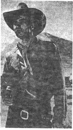
RED RIVER von Howard Hawks