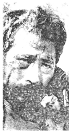
HELL IN THE PAZIFIK von John Boorman

Die anschliessende Diskussion verdeutlichte im wesentlichen die im Referat erwähnten Schwierigkeiten und förderte noch weitere Probleme zu Tag. Und der Sinn der Übung? Von Zeit zu Zeit ist es ganz heilsam die eigenen Ansichten radikal in Frage gestellt zu sehen. Auch war von Anfang an klar, dass dieser Kurs keine Rezepte liefern würde - dazu war er zu gut!