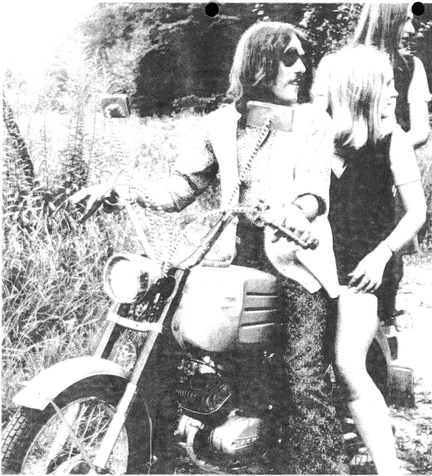
POWERS, BORN TO HELL

gen Leuten Filme zu drehen; bis allgemein eingesehen wird, dass es möglich und sinnvoll ist Leuten die Aufgabe zu stellen, sich selbst oder ihre Gruppe und ihre Beziehung zur Umwelt in einem Film darzustellen. Auch wenn einzelne Experimente missraten mögen, kann kein Zweifel darüber bestehen, dass solche Filme zu machen eine echte Lebenshilfe sein kann. (Es sei erlaubt, in diesem Zusammenhang auf die Arbeiten von Hr. Werner Fäh hinzuweisen, der meines Wissens der einzige ist, der bei uns heute schon solche Versuche durchführt.)