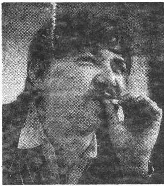
Rainer Werner Fassbinder

preis für seinen zweiten Film (Katzelmacher) und zeigte gleichzeitig auf der Berlinale seinen vierten (Warum läuft Herr R. Amok? / Filmbulletin 3/70) und hier lief bereits etwa sein neunter Spielfilm: DER AMERIKANISCHE SOLDAT. Ein perfekter Thriller, alles läuft ab, wie es ablaufen muss, kaum ein Klischee des billigen Kriminalfilms fehlt: der Killer kommt auf Bestellung, killt und kassiert - und wird zum guten Ende umgelegt. Wie gehabt! Und doch nicht ganz so. Alles ist um jene winzige Idee übertrieben, die jede Geste der Lächerlichkeit preis gibt. Grosse Entschleierung einschlägiger Krimi-Klischees - noch nie hab ich in einem Krimi so gelacht. Und noch eine Kleinigkeit (?) ist verdreht: die Bullen, welche den Killer anheuern sind Kriminalbeamte der Münchner Polizei; der Killer hat 'bloss' einen Homosexu-