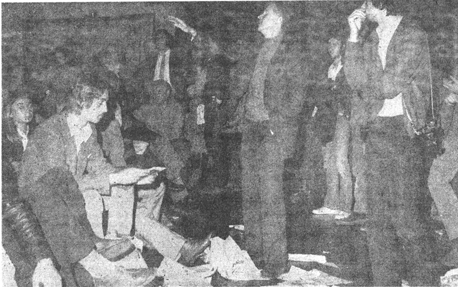
Jean Marie Straub (Mitte) stellt sich den Kritikern

Falls es sinnvoll und nützlich ist, dass einige in ihrer Umgebung die gängigsten Meinungen attackieren, die gesichertsten Schablonen zerstören und so immer als korrektiv wirken - und ich meine, dass dies nützlich und sinnvoll ist, so hat Straub einen wichtigen, sinnvollen, guten Film gemacht. Denn er hat radikal und nach allen Seiten hin zerstört! Er hat den Kulturbauschen ihren Corneille verteuftelt; den Aestheten einen ausgewischt und den sogenannt Progressiven und