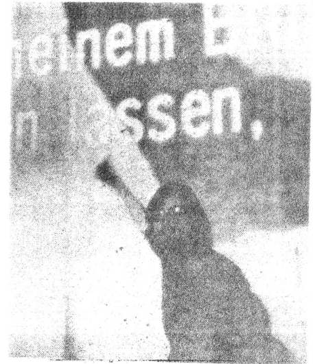
ZUSCHAUER VERLANGT ABRUCH DES FILMS

"Kulturscheisse!", Pfiffe vom andern Ende des Saales, in Schaaren wandern Zuschauer hinaus - so beginnt es, und auch Mannheim hat seinen kleinen Skandal. Die Demonstranten formieren sich zu Sprechchören, trommeln wild mit den Fäusten auf den Bühnenboden und fordern den Abbruch der Vorführung. In 'verzweifelt' Einzelaktionen werden Jacken und Mäntel vor die Leinwand gehalten und