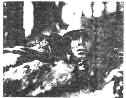
ZU KLEIN FUER EINEN GROSSEN KRIEG

Aber nichts da Pause. Schon steige ich wieder in die Dunkelheit und komme gerade noch rechtzeitig zum, im Informationsprogramm laufenden, rumänischen Spielfilm ZU KLEIN FUER EINEN GROSSEN KRIEG. So ähnlich er, auf den ersten Blick, dem russischen Film "Iwans Kindheit" zu sein scheint, einen wesentlichen Unterschied, bereits in der Anlage der Geschichte, gibt es: der kleine Trompetenspieler ist zunächst vom Krieg hell begeistert, folgt den ihm mächtig imponierenden Soldaten um jeden Preis und wird erst mit der Zeit, nachdem er einen um den andern seiner grossen Freunde verloren hat, nachdenklich und traurig, während Iwan von Anfang an verwirrt, durch die schrecklichen Ereignisse aus der Bahn geworfen ist.