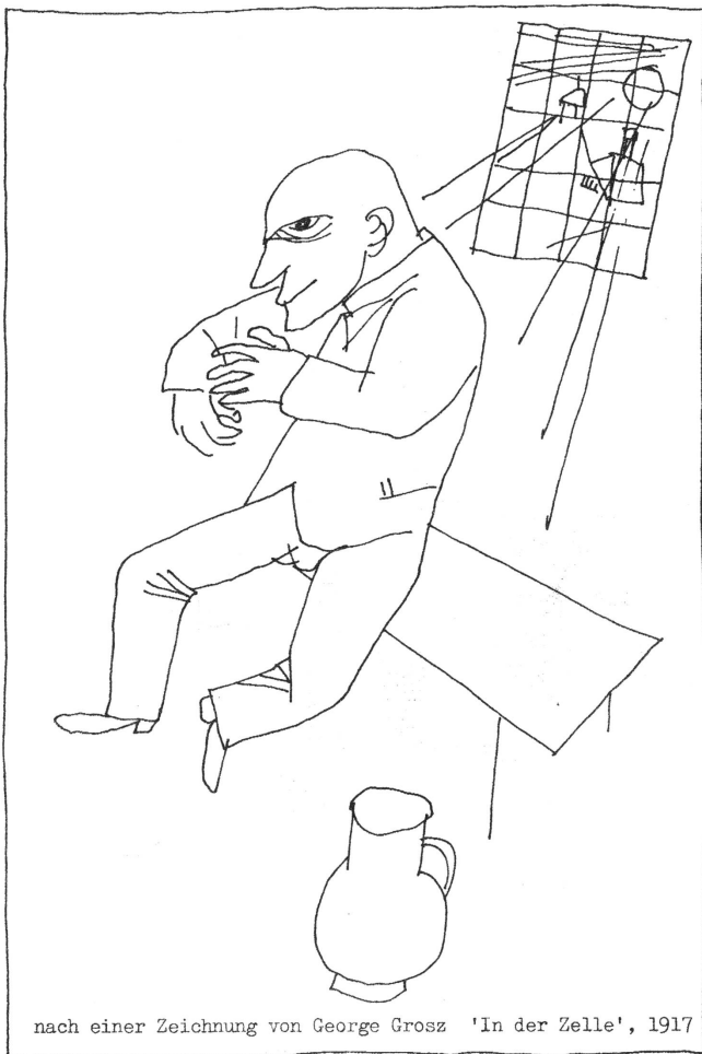
nach einer Zeichnung von George Grosz 'In der Zelle', 1917

dazu kommen die Ängste bezüglich der eigenen Familie oder Freundin. Sexualität und Homosexualität sowie das Essen werden während der Haft zu einer wahren Obsession. Bei 2-3jährigen Haftstrafen, überfüllten Zellen und mangelnden Räumlichkeiten ist an Rehabilitation einfach nicht zu denken. Im Film wird nur einmal auf dieses Problem hingewiesen: die Kamera schwenkt auf eine geschlossene Tür mit der Aufschrift 'Rehabilitations-Officer', dann auf das Schild darunter 'No-Entrance'. Eine weitere Erklärung war wirklich nicht mehr nötig.