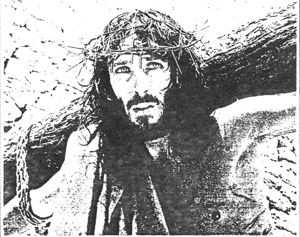
JESUS OF NAZARETH