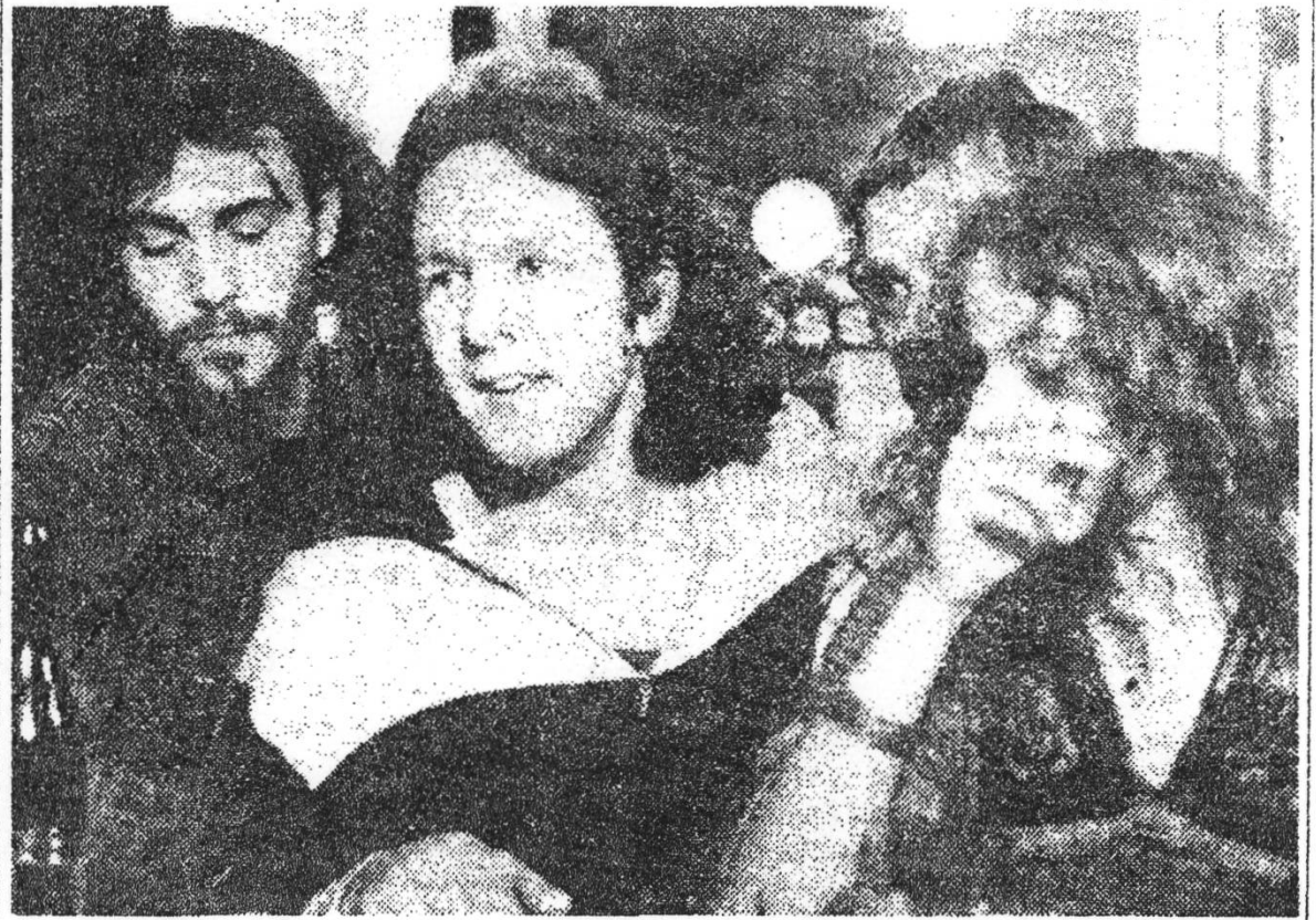
KLEINE FRIEREN AUCH IM SOMMER von Peter von Ganten