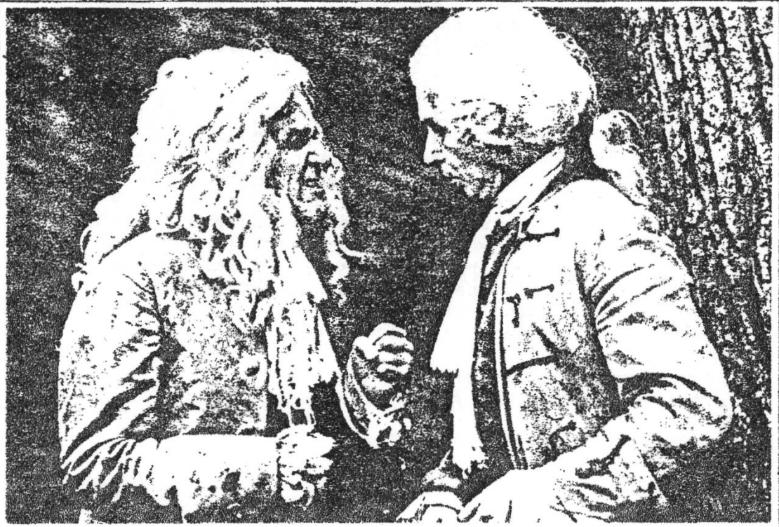
Rousseau u. Voltaire in ALZIRE ODER DER NEUE KONTINENT