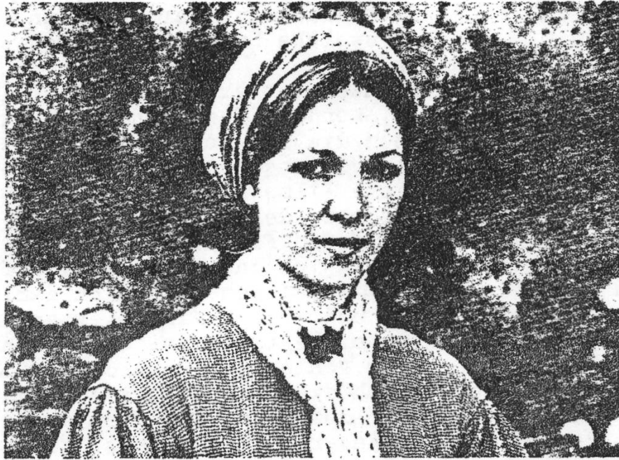
L'ALBERGO DEGLI ZUCCOLI von Ermanno Olmi, Italien