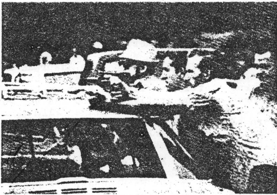
HARLAN COUNTY, USA von Barbara Kopple, USA