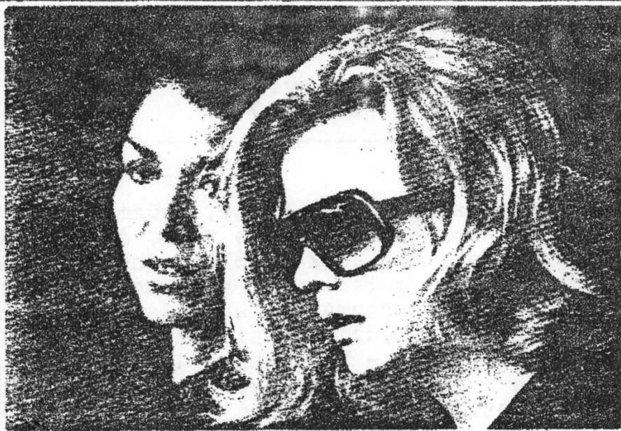
Festival-Eröffnungsfilm OPENING NIGHT von John Cassavetes, USA