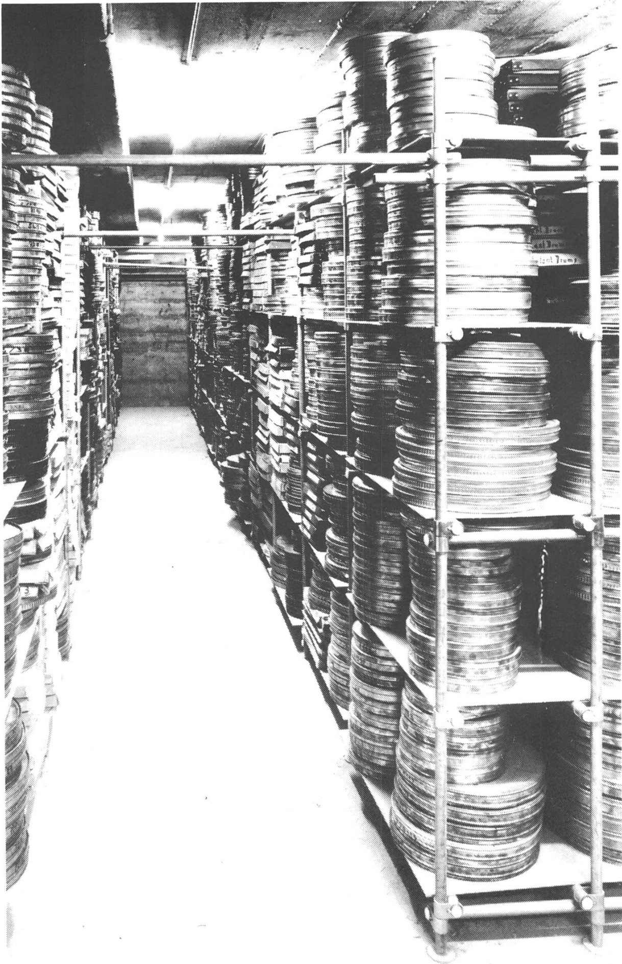
Blick in eines der diversen Filmlager der Cinémathèque Suisse