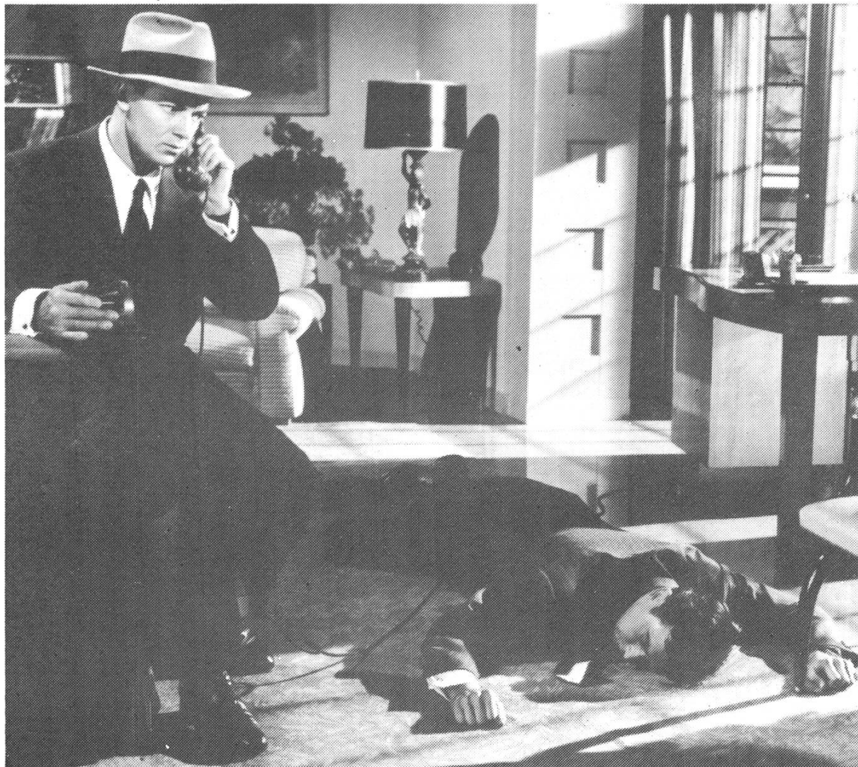
SHOCKPROOF, Douglas Sirk (Drehbuch Samuel Fuller)