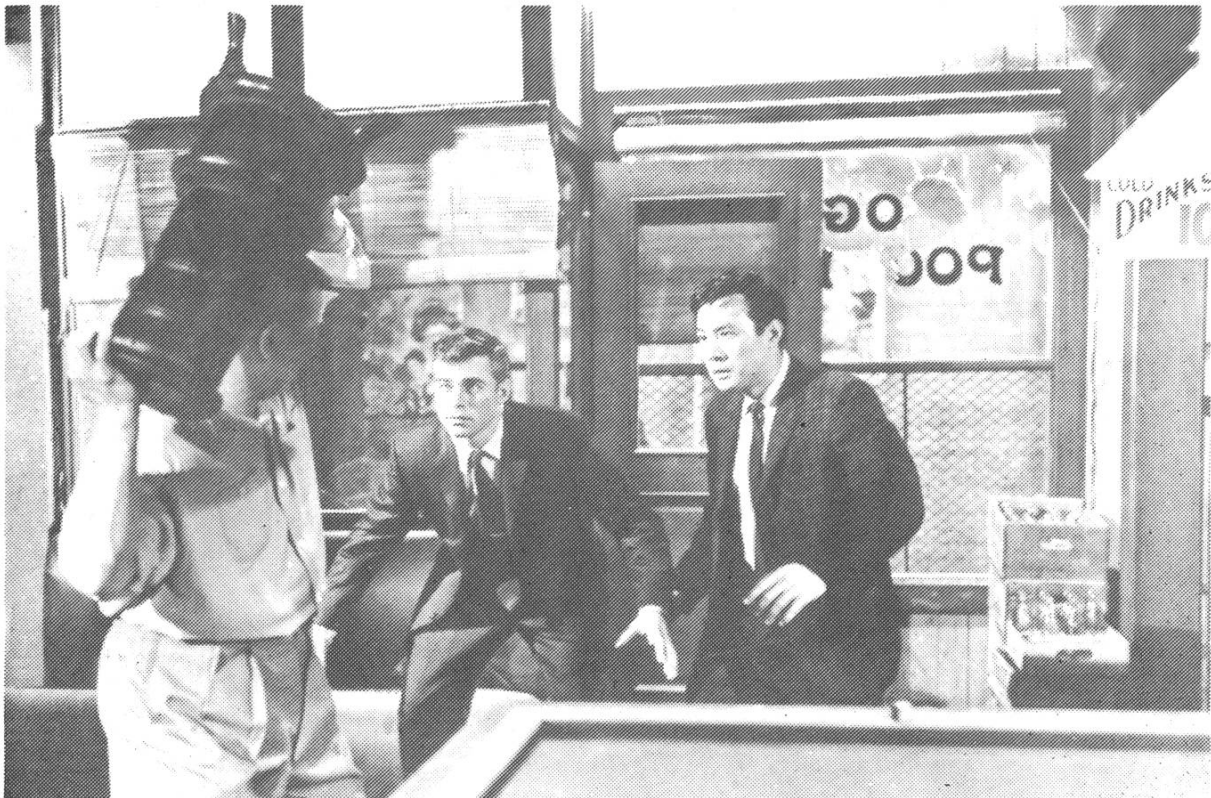
THE CRIMSON KIMONO, Samuel Fuller