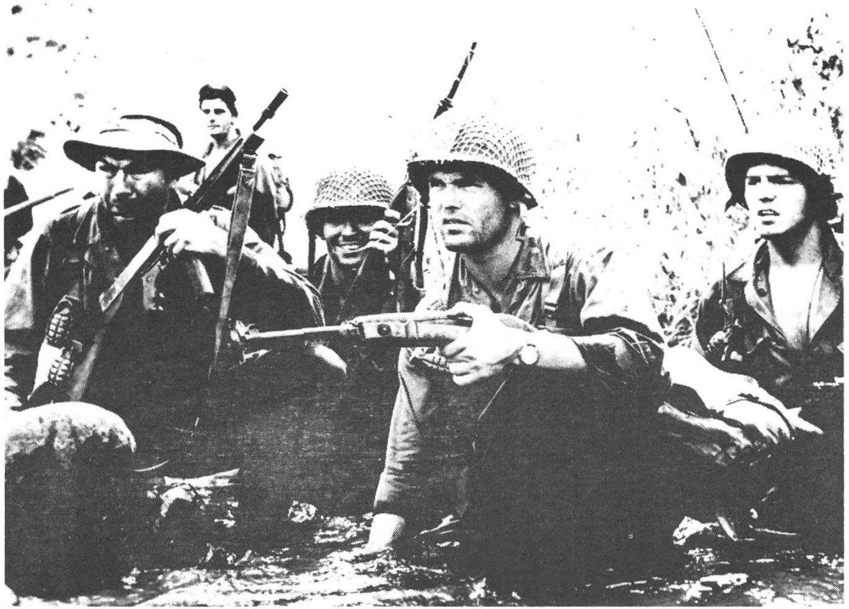
MERRILL'S MARAUDERS (oben)