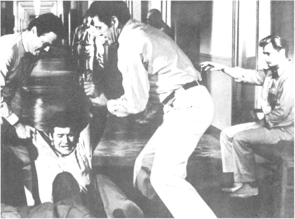
SHOCK CORRIDOR, Samuel Fuller