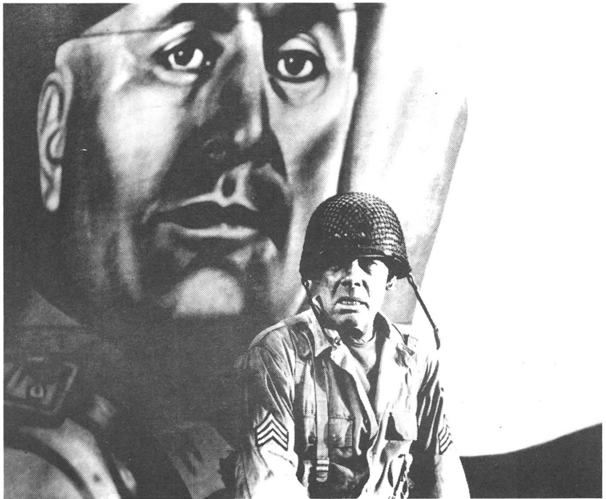
THE BIG RED ONE (unten)