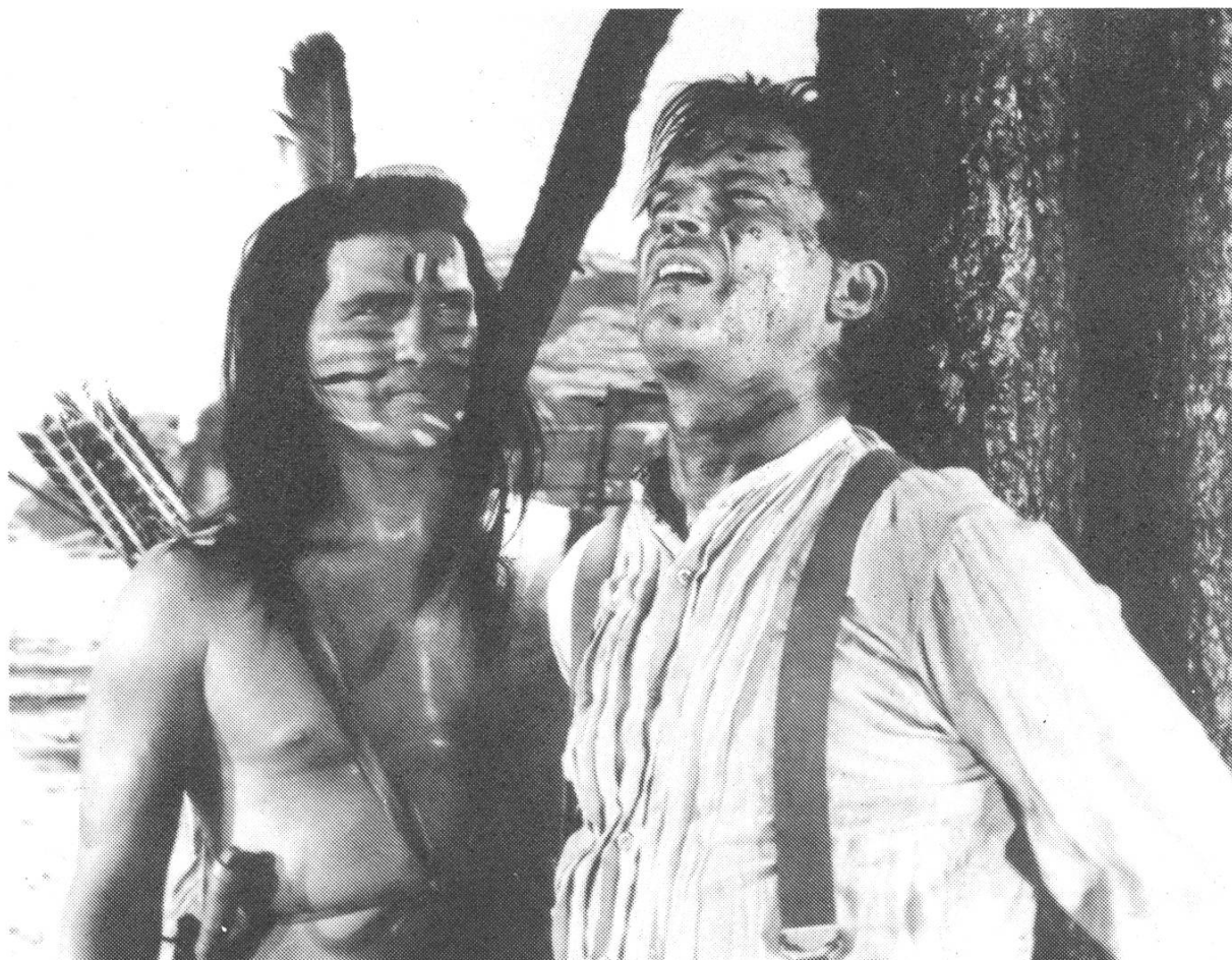
RUN OF THE ARROW (unten)