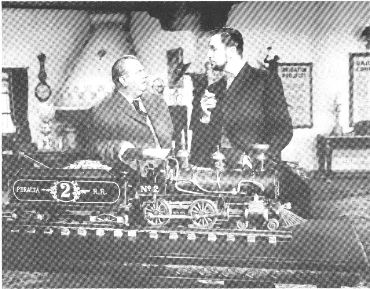
THE BARON OF ARIZONA (oben)