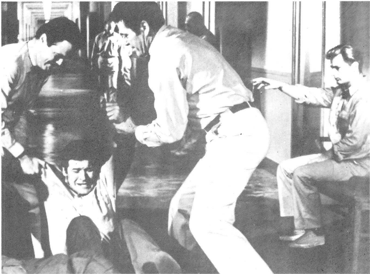
SHOCK CORRIDOR, Samuel Fuller