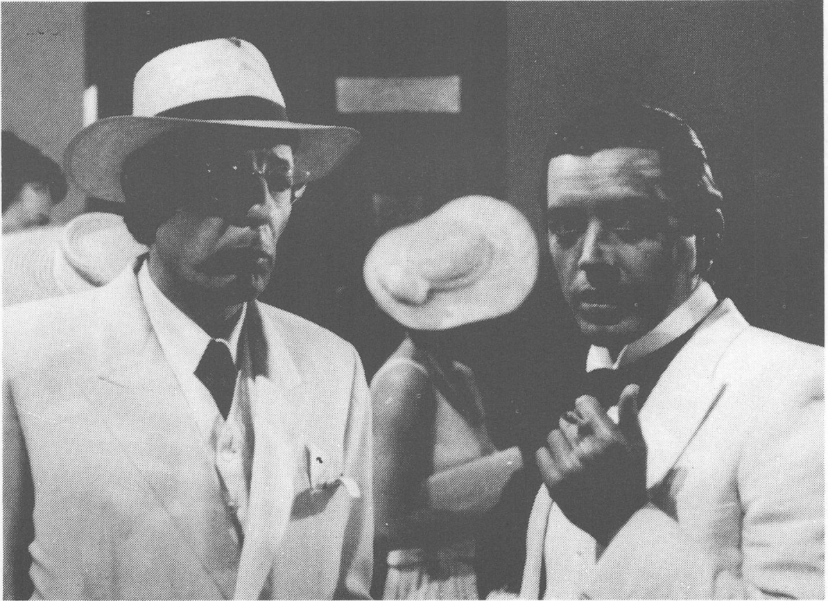
Der Konsul (Jean Bouise, links) und sein Attaché in der nordafrikanischen Kolonie: Il n'y a rien a faire et je le fait! – Julien Rochelle (Bernard Giraudeau, unten links) bei einem Essen 1942 in Bern: Zeit zur Erinnerung