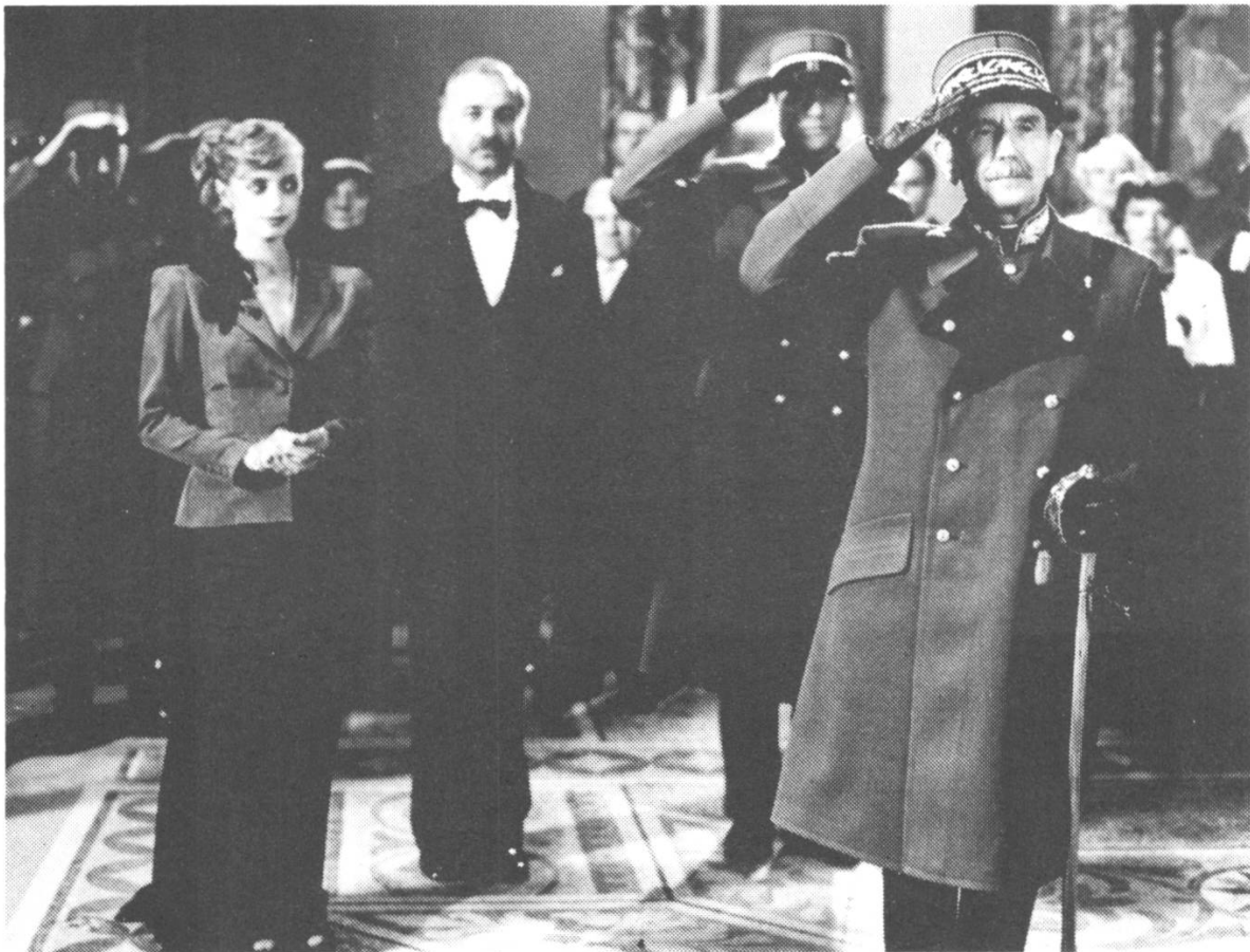
Szene 79 (Aussen / Dämmerung / Vorplatz): Der General steht grüssend ...

Donnerstag, den 13. Januar 1983: 9. Drehtag bei Thomas Koerfers neuem Spielfilm GLUT IM HERZEN (Arbeitstitel). Laut Tagesdisposition ist der allgemeine Arbeitsbeginn auf 13.30 Uhr angesetzt - Filmer müsste man sein, mag manch einer denken; immerhin ist Vorsicht geboten: "Drehschluss ca. 24 Uhr" -; Drehbeginn um 15 Uhr beim Schloss Castel in der Nähe von Tägerwilen ob Kreuzlingen am Bodensee. Gedreht werden die Szenen 79, 82 und 87 - oder eben: "die Ankunft des Generals". 79 (Aussen / Dämmerung / Vorplatz): "Die Villa Korb in gedämpfter Festbeleuchtung, zur Feier des Generalsempfangs. Der trotz Winterkälte offene Dienstwagen des Generals ist vorgefahren. Die Gäste, unter ihnen viele hohe Militärs, bilden unter dem Dach ein Spalier. Oben an der Treppe die Gastgeber: Claire Korb ist überwältigend anzusehen. Der etwas abseits stehende Chor stimmt die Landeshymne an ... Der General steht grüssend, Hand an der Schirmmütze." (nach Drehbuch) Regie und Equipe verlassen kurz nach eins das Hotel; aber ab 10 Uhr wurden in Garderobe und Maske bereits "fünf weibliche Gäste", ab 10 Uhr 30 "sechs männliche Gäste", dann "vier Wachen, der Adjutant des Generals, sechs Offiziere und ein Leutnant" ausgestattet und hergerichtet, hatte der Darsteller des Generals, Robert Tessen, eine Maskenprobe. Die Hauptdarstellerin Katharina Thalbach ging kurz nach elf zu Garderobe und Maske.