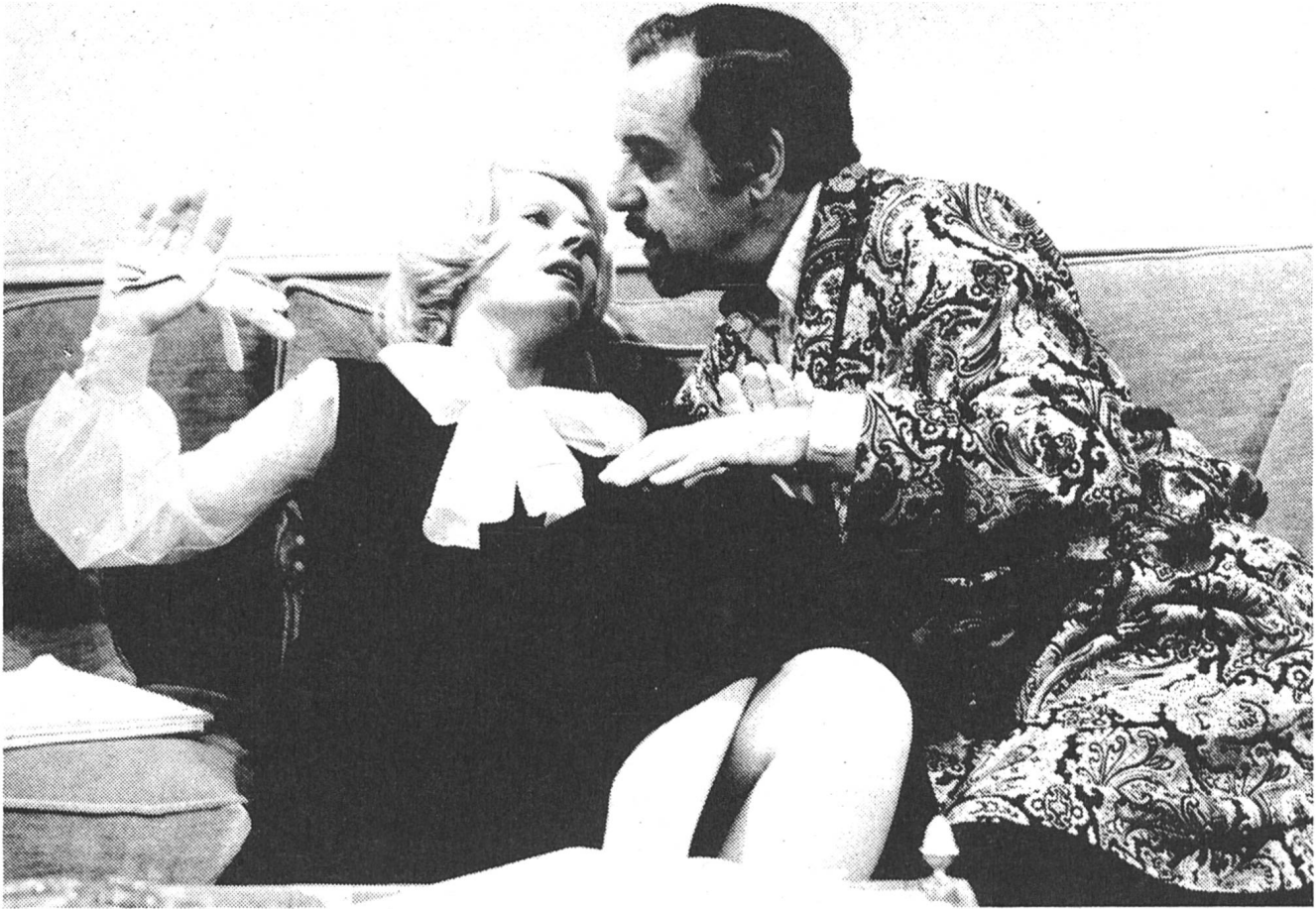
LA CHARME DISCRET DE LA BOURGEOISIE ich lebe schlecht, aber ich lebe, ohne zu arbeiten

in Mexiko gelesen hatte: «Ein Mann geht in die Nummer 39 einer Strasse und fragt nach einem Herrn Sanchez. Der Hausmeister versichert ihm, dass er keinen Herrn Sanchez kenne und dass er sicher in der Nummer 41 wohne. Der Mann geht nach Nummer 41 und fragt nach Herrn Sanchez. Der Hausmeister von Nummer 41 antwortet, dass Sanchez doch auf 39 wohnen und der andere Hausmeister sich geirrt haben müsse. - Der Mann geht wieder nach 39 und erklärt dem Hausmeister, was er gehört hat. Der Hausmeister bittet ihn, doch un momento zu warten, geht in einen Nebenraum, holt seinen Revolver und schießt den Besucher über den Haufen.» Die Geschichte stand in der Zeitung unter dem lakonischen Titel: Getötet, weil er zuviel fragte.