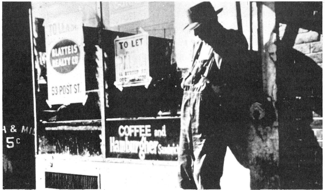
NATIVE LAND (1938-1941): In den USA sind 1932 mehr als 12 Mio. Menschen arbeitslos ...