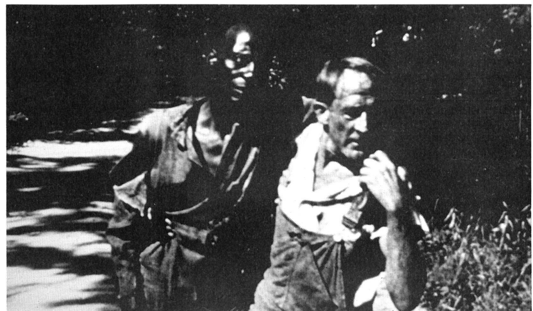
... dennoch: Solidarität zwischen Schwarz und Weiss.

verfasst von Verena Zimmermann, heraus, die nebst einer Filmografie, eine breitere Darstellung von DIALOGUE WITH A WOMAN DEPARTED, Einzelporträts oder Kurzbeschreibungen aller Filme und einen Text von Leo Hurwitz enthalten wird. Ca. 50 Seiten, Preis sFr. 5.- (bei den Veranstaltern erhältlich)