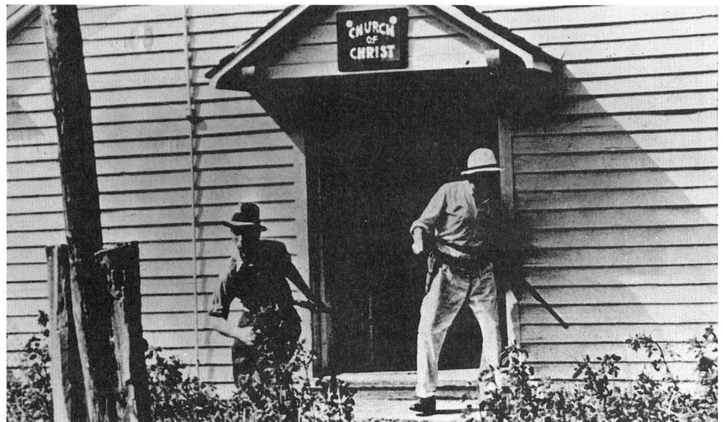
Baumwollpflückern wird das Recht auf Streik mit Gewalt streitig gemacht ...

Aus Anlass der Werkschau Leo Hurwitz geben das Stadtkino Basel und das Filmpodium Zürich eine