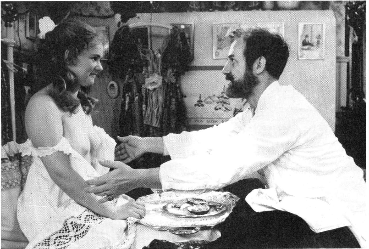
Bergman gelingt es, Lebensfreude ungeheuer konzentriert zu vermitteln und nachzuzeichnen

zunehmen, seinen Blickwinkel zu halten. Er glaubt daran, dass wir «im Innern alle ein wenig Kind geblieben sind», dass einige von uns zudem offene Kanäle zum Erwachsenen-Bewusstsein haben. »Als Kinder waren wir sehr fasziniert von Märchen, von magischen Erscheinungen. Da ich selber sehr nahe zu meiner Kindheit lebe, ist es kein Problem für mich, mich zu erinnern, was ich von Leben und Tod, von Geistern und Dämonen gehalten habe, als ich noch ein Kind war. Ich lebe nahe bei all diesen Dingen. Als Erwachsener schau ich sie ganz einfach ein wenig anders an. Aber dies ist nicht so wichtig.« Auf seine Weise ist auch FANNY OCH ALEXANDER ganz einfach ein Märchen, das geprägt ist von Bergmans festem Glauben an das Gute im Menschen. In einem anderen Zusammenhang hatte er vor mittlerweile vierzig Jahren in einem Artikel geschrieben: »Filmemachen hat seine Wurzeln ebenfalls tief unten in meiner Kindheit, dem tiefsten Stockwerk meines eigenen Workshops.«