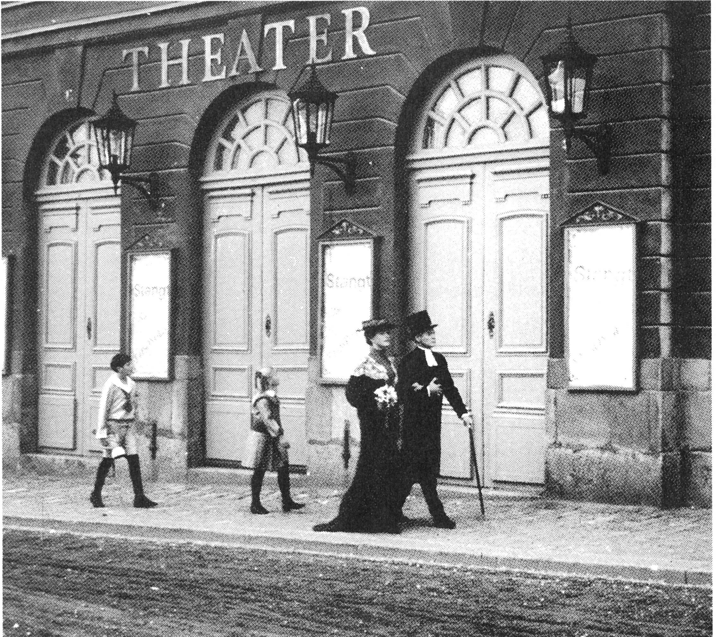
Fanny und Alexander Eckdahl mit den Eltern vor dem eigenen Theater