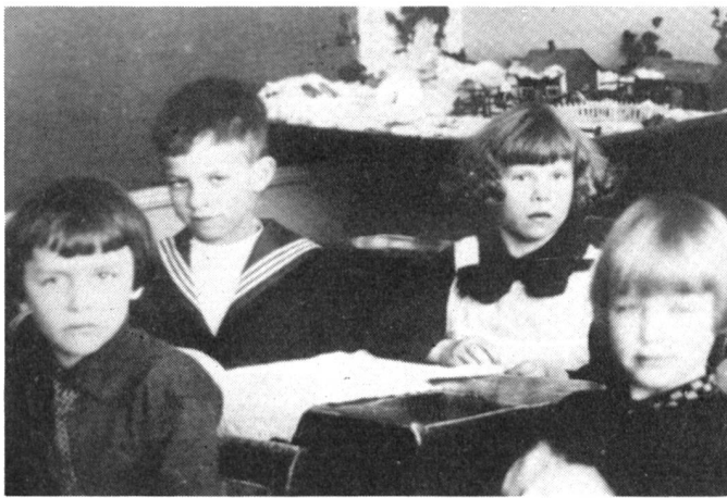
»Filmemachen hat seine Wurzeln tief in meiner Kindheit« - der junge Ingmar Bergman, bzw. Alexander im Matrosenanzug

Leben ein grosses Theaterstück, das man gut oder schlecht inszenieren kann.