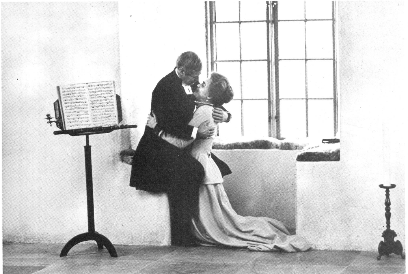
Bergman zeichnet einen Bischof, dem Erniedrigung und Demütigung Mittel zum «richtigen» Leben sind