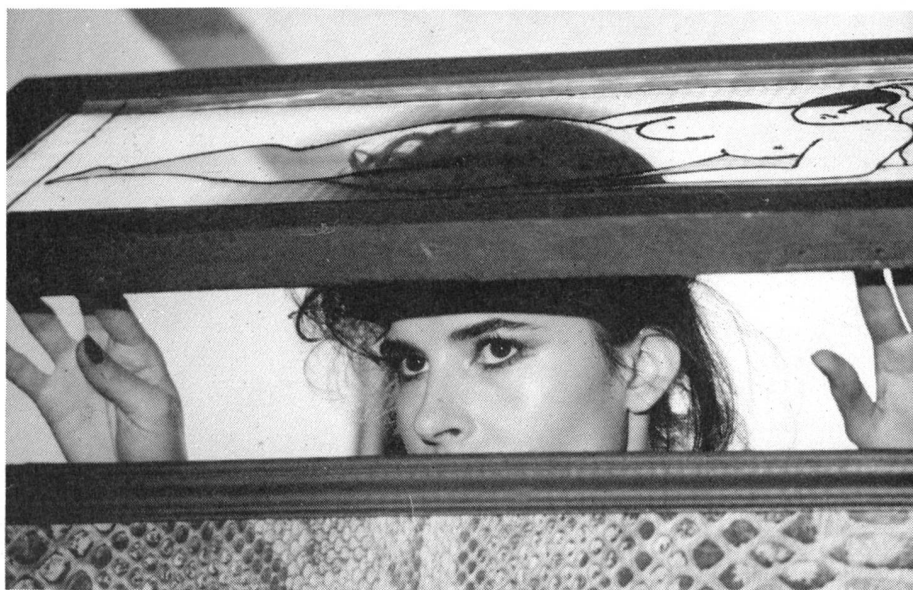
... herumsponiert - nur weil sie ihn liebt.