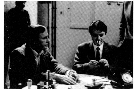
Die Blonde reizt mit dem Bein, und der Mörder steckt sich vor lauter Aufregung gleich zwei Zigaretten ins Gesicht.