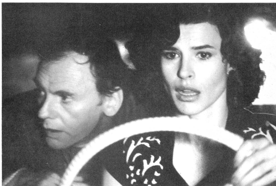
... die für ihn und mit ihm kämpft, für ihn das Abenteuer wagt, ...