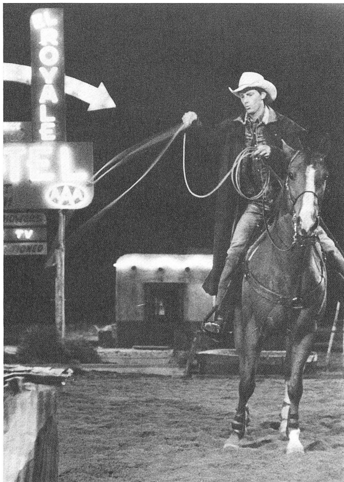
Unausweichlichkeit aufgrund von Obsession