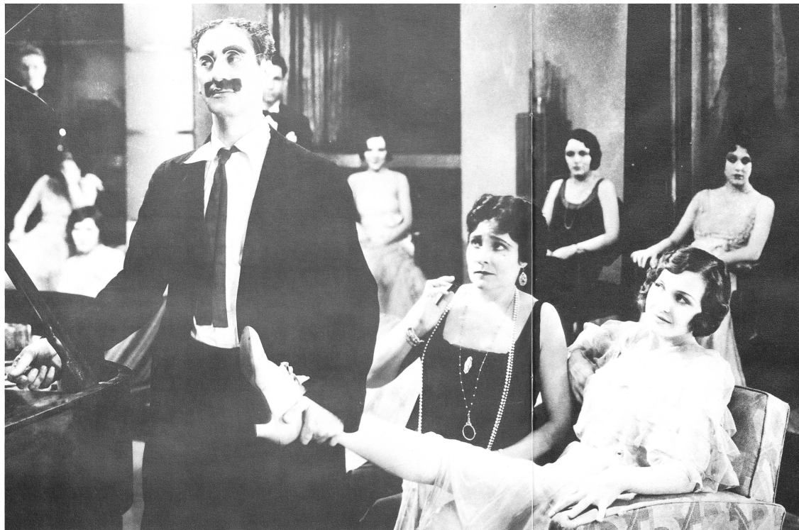
Margaret Dumont – wer sonst? – verkörperte jeweils eine stattliche Lady zwischen Millionärswitwe, Muttergestalt und Blitzableiter für unzählige Jokes.