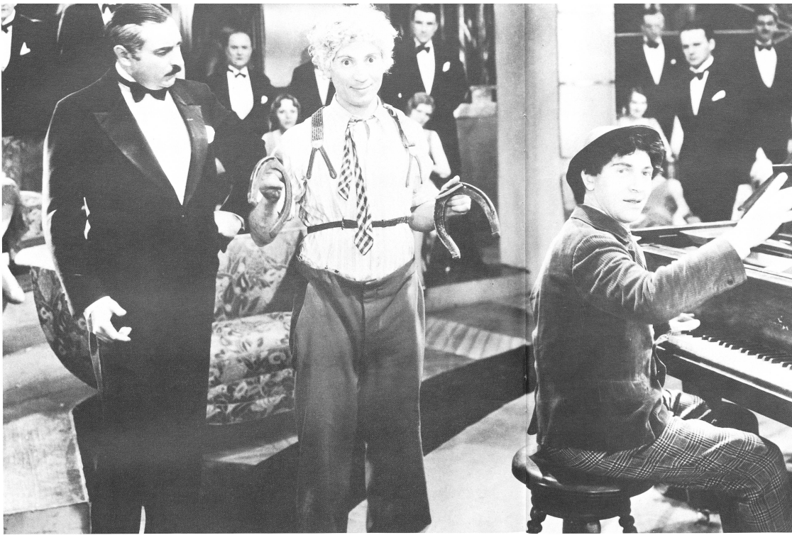
Nein sie scheren sich nicht um Gesetze und Regeln, von Fairness gar nicht zu reden.