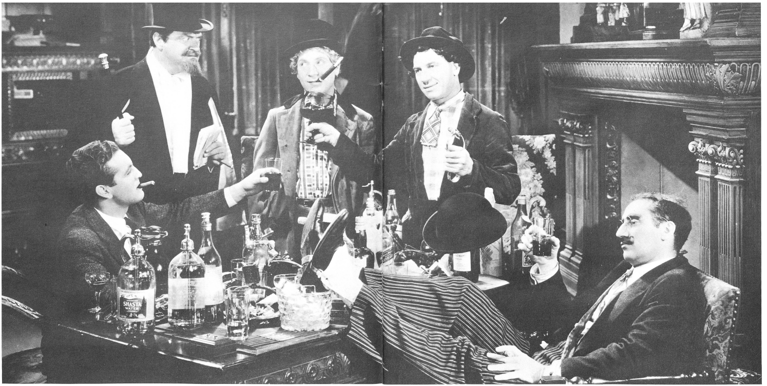
A NIGHT AT THE OPERA