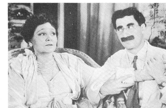
AT THE CIRCUS (1939)

dass wir soeben etwas Gutes gemacht hatten. Es war das verrückteste Publikum, für das wir je spielten.» Florey als Testpublikum? Groucho meinte eher das Gegenteil, als er enttäuscht erzählte, die Paramount hätte ihnen – american comedians! – einen französischen Regisseur gegeben, der nicht richtig Englisch gekonnt habe. Und Florey selbst? Natürlich wollte er von Grouchos Vorwurf nichts wissen. «Die Kreidestriche, die seinen Bewegungsraum begrenzen, und die Position der schwerfälligen Mikrophone waren eine dauernde Quelle für Grouchos Reizbarkeit. Er trat über die Kreidemarkierung, sein Kopf ging aus dem Bildausschnitt, und ich musste die Kameras stoppen und ihn bitten, im Kamerawinkel zu bleiben und direkt in eines der Mikrophone zu sprechen. Das hat ihn jeweils wütend gemacht.» Sicher hat es mehr als zwei Gründe gegeben, die Kameras zu