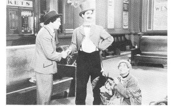
GO WEST (1940)