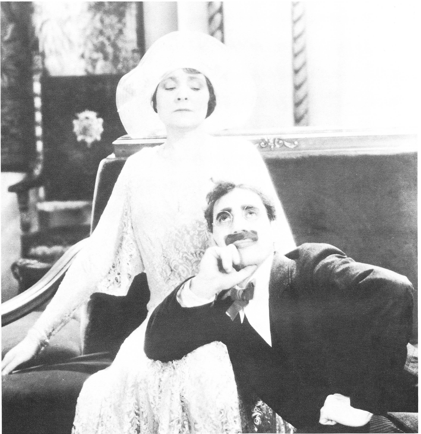
Groucho, mit seinem angemalten Schnauz, macht's mit Sätzen, mit der Stimme, mit Wörtern. Er tut sich keinen Zwang an, auch in der Society nicht.

Ein Blick in zwei alte Zeitschriften? Eine Nummer des «Time»-Magazin, 31. Dezember 1951. Auf der Titelseite, rotgerandet, Groucho Marx in einer Porträtzeichnung. Launig-forscher Blick, sich lichtendes Haar und Nickelbrille, die Cigarre aus dem Mund ragend. Die Bildlegende: «Markenzeichen: Unverschämtheit». Er soll's – gerahmt – zu Hause aufgehängt haben. Die Huldigung im Innern des Heftes – eine Seite, «Personality» betitelt – ist ungezeichnet, handelt mehr von Grouchos TV-Quiz als von den Jahren, als die Filme reden lernten, und beginnt mit dem Satz: «Für einige Amerikaner konkretisiert sich der Name Marx in einem bärtigen Propheten der sozialen Verelendung, aber für die meisten bedeutet er ein clowneskes Durcheinander von Brüdern.»