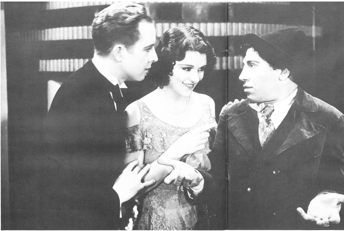
«Chico mag aussehen wie ein Idiot, er mag reden wie ein Idiot, aber lassen Sie sich dadurch nicht täuschen – er ist wirklich ein Idiot.»