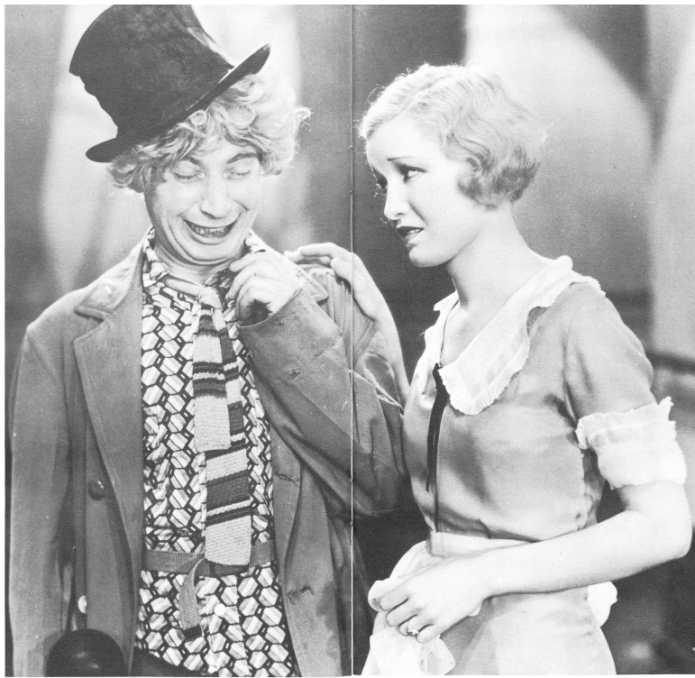
Harpo wird mit einer Schere tätig und haut alles ab, was an Status und Prestige gemahnt: Krawatten, Frackschösse, Cigarren, Federn. MONKEY BUSINESS