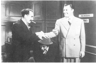
THE BIG STORE