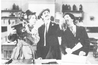
THE BIG STORE