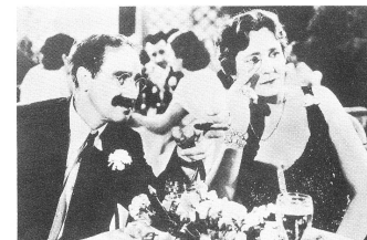
A NIGHT AT THE OPERA