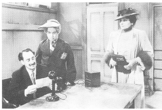
THE BIG STORE (1941)