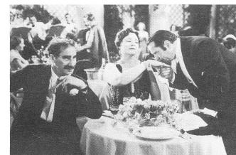
A NIGHT AT THE OPERA (1935)