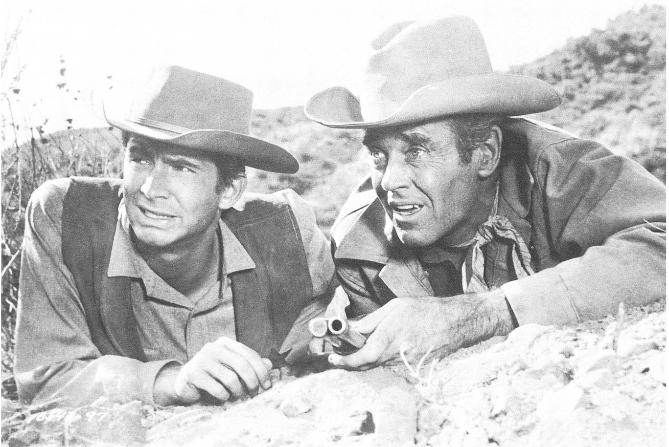
Henry Fonda und Tony Perkins in THE TIN STAR

Die Schönheit der Mann-Filme – für die Leute bei den Cahiers kam sie allein von ihrer Physis: die Konzentration, die Anstrengung, der Schweiß machen die Wahhaftigkeit ihrer Menschen aus, die keine Schauspieler mehr sind, sondern Akteure, die den Körper einsetzen und den Intellekt. Sie stellen nicht dar, sie handeln, und ihr Handeln ist organisch. Die Verbissenheit von James Stewart, das ist seine Anstrengung, wenn er all seine Stunts selber macht – reiten, Felsen emporklettern, durchs Feuer geschleift werden. Für WINCHESTER '73 lernte er ein Repetiergewehr handhaben, für THE MAN FROM LARAMIE bekam er einen Original-Henrystutzen in die Hand. Die Leute müssen sich der Objekte bedienen, sagt Mann, das ist die einzige Möglichkeit, Realismus zu