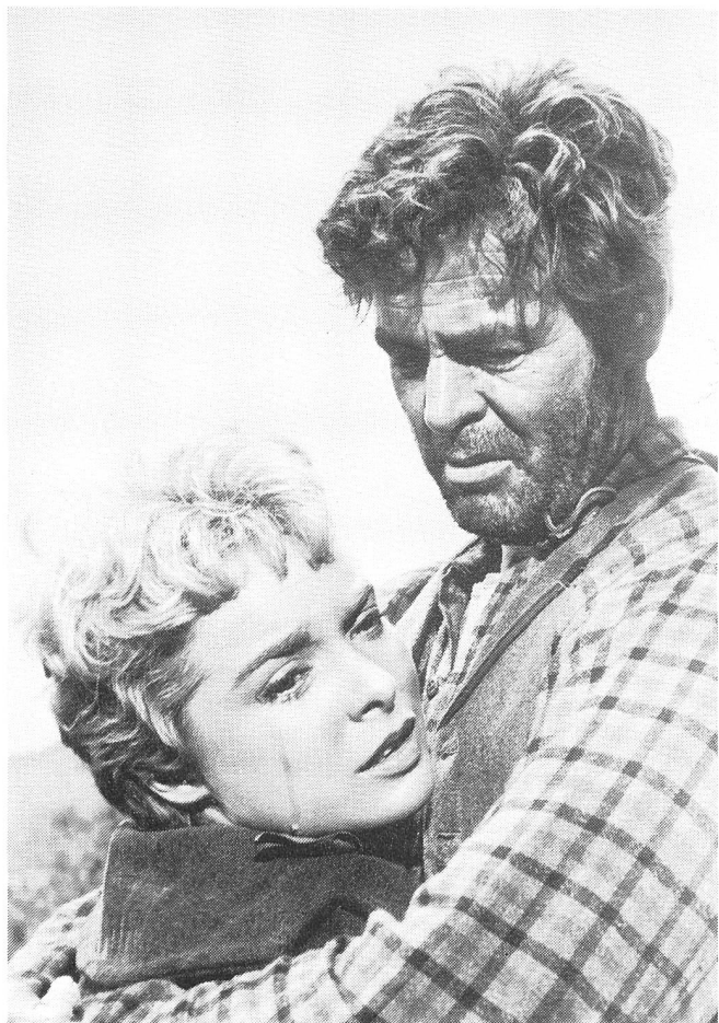
Janet Leigh, Robert Ryan in THE NAKED SPUR

Mit Shakespeare hat man immer wieder Manns Filme zusammengebracht, das kommt einmal von Philip Yordan