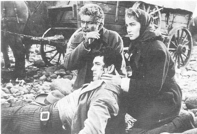
BEND OF THE RIVER

erzielen im Western. Dann ist der Instinkt vereinigt mit der Reflexion: «Mit den Muskeln», erklärt Henry Fonda in THE TIN STAR Tony Perkins beim Probeschüssen am Fluss, «musst du schnell sein, mit dem Verstand aber musst du einen winzigen Augenblick zögern.»