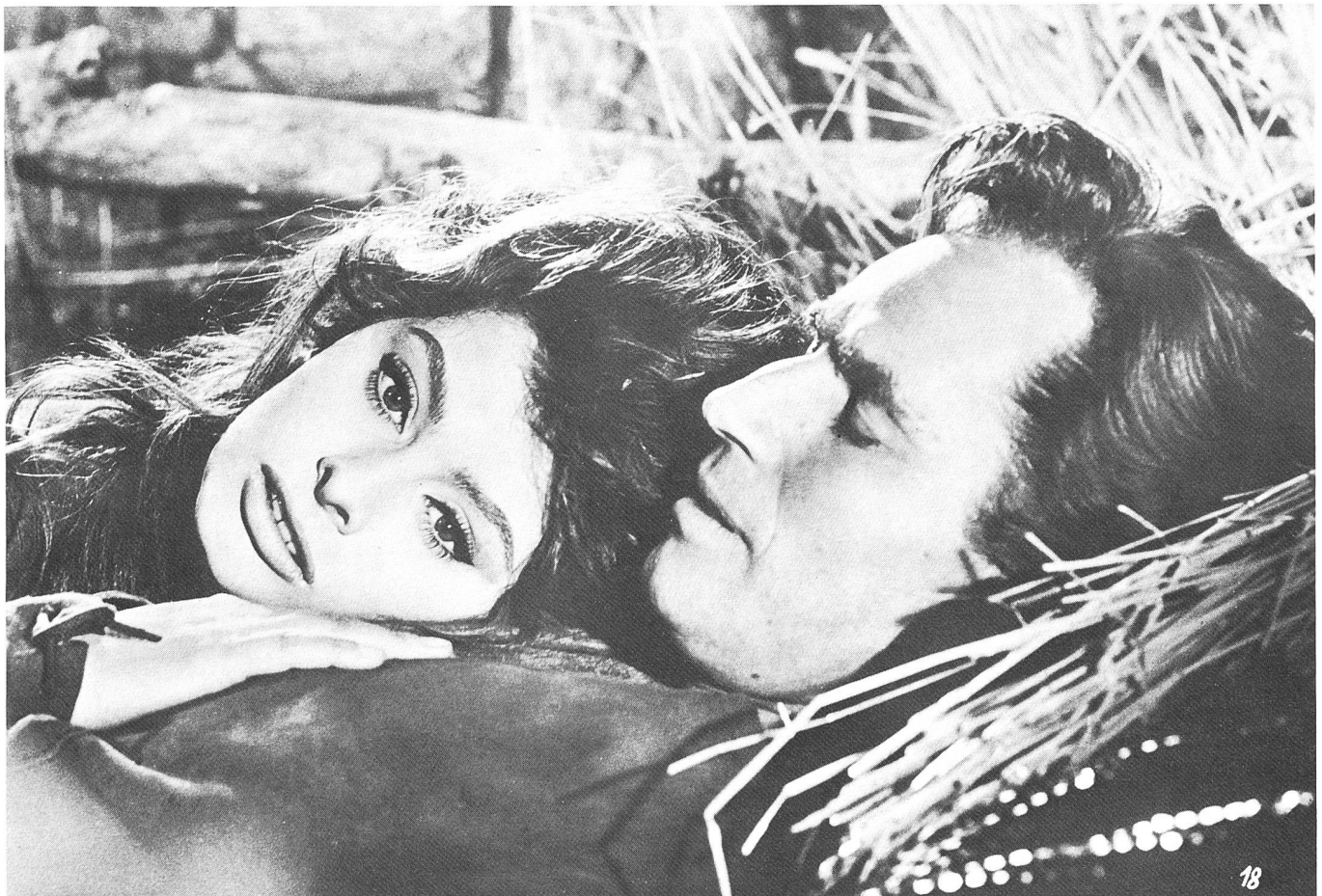
Sophia Loren und Charlton Heston in EL CID

Eine Geschichte, die sich selbst aufhebt, von einem ersten misslungenen Attentat auf Lincoln. Solange der Zug in Bewegung ist, bleiben alle Möglichkeiten offen: die neue Nation ist noch nicht geboren, ihr neuer Präsident kommt heimlich zur Amtseinführung, wie ein Dieb in der Nacht. So kommt auch Gary Cooper in MAN OF THE WEST , mit seinen zwei Begleitern, zurück auf die kleine Farm, den Schlupfwinkel der Bande, zu der er früher gehörte, so idyllisch gelegen, dass man sieht, seine bürgerliche Zukunft bedeutet einen unwiederbringlichen Verlust seiner lebendigen Vergangenheit. Die Gewalt ist ihre erste Tugend, sagt Rivette von Manns Helden, doch die Gewalt habe kein anderes Ziel als – nachdem die Konventionen zertrümmert worden sind – eine Leere zu schaffen, einen Zustand der Gnade, in der die Helden sich selber prüfen mögen: Gewalt und Meditation so aneinandergebunden, dass sie nicht zu trennen sind, ohne dass die Seele der Filme zerstört würde. In Washington wird es für Lincoln den Stillstand geben, dann steht er auf einer Seite, dann verkörpert er das neue Gesetz.