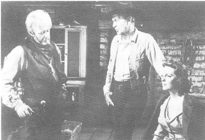
MAN OF THE WEST