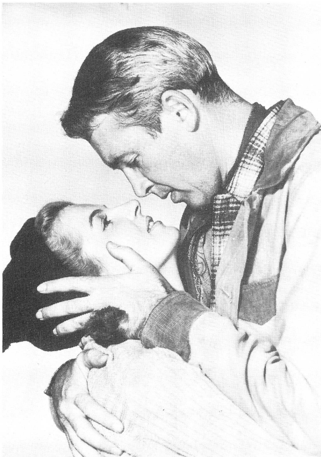
Corinne Calvet, James Stewart in THE FAR COUNTRY

'Enzyklopädisch' wurden Manns frühe Filme rezipiert, sie setzen sich zu einem Körper zusammen, dessen Zusammenhalt mehr als die Themen oder Motive die Arbeit der Techniker und Akteure besorgt, John Alton zum Beispiel mit seinem noir -Licht, oder Charles McGraw, Manns liebster heavy , ein Kinderschreck und Sadist. Mann wurde nicht als isolierter Filmemacher gesehen, sondern im line-up mit anderen; Jacques Rivette steckte ihn zu den Hollywood-Revolutionären Aldrich, Brooks und Ray; Manny Farber 1957 in den Stamm mit Hawks als Häuptling, zu Keighley, Walsh und Wellman: «Manns Unmenschlichkeit dem Menschen gegenüber, deren Markenzeichen tödlich-kalte Planmässigkeit ist, lässt sich am besten in THE TALL TARGET, WINCHESTER '73,