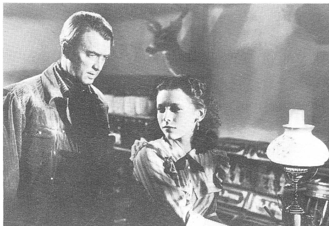
THE MAN FROM LARAMIE

Ihre Geschichten arrangieren diese Filme nicht nach vorwärts, der narrativen Logik gemäss, sondern nebeneinander, übereinander. Immer wieder zieht der Blick der Kamera in singulären Einstellungen sich zusammen, die er aus dem Fluss des Filmes löst, Konzentrate von Geschehen, Blicke wie durchs Vergrösserungsglas. THE GREAT FLAMARION , erzählt Mann, wäre, wenn es nach seinem Hauptdarsteller Stroheim gegangen wäre, wie der Blick durch dessen Monokel inszeniert worden, das muss, als Idee eines Blicks, Mann für immer im Kopf geblieben sein. Wie Stroheim rückt er die Kamera, closing up, an seine Objekte, die Menschen und Gegenstände heran, seine Bilder sind intensiv, funktionieren durch Ausschluss.