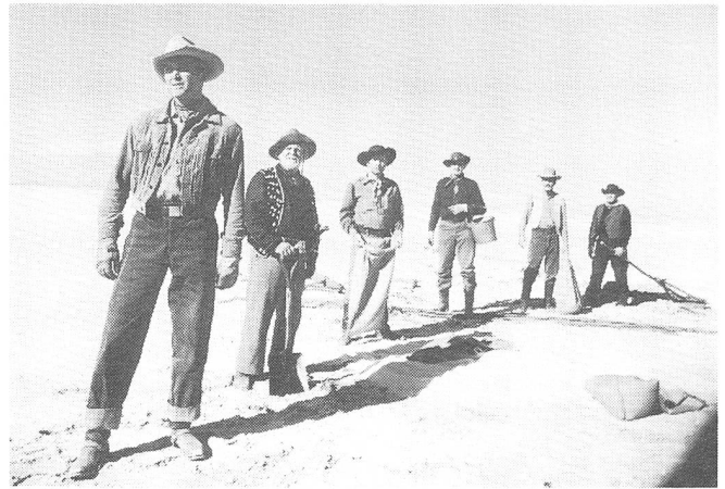
THE MAN FROM LARAMIE

Seinen Filmen geht Fullers und Rays Zerrissenheit ab, doch gerade in ihrer strengen Einheit ist eine Ahnung kompensiert, dass es zum Beginn der Fünfziger schon vorbei ist mit der Selbstverständlichkeit des filmischen