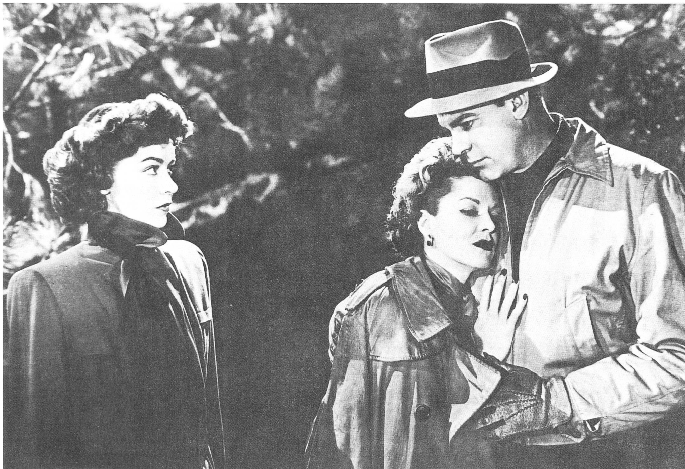
Marscha Hunt, Claire Trevor und Dennis O'Keefe in RAW DEAL

schen ist bei Mann multipliziert, durch ständige mise en surprise . Wie Dominosteine sind die Sequenzen seiner Filme aneinandergestellt: «Wenn der Augenblick das Differential der action ist», sagt Deleuze in seinem Kinobuch, «kann die action in jedem dieser Augenblicke umkippen, in eine ganz andere oder sogar entgegengesetzte Richtung.» In THE TALL TARGET durchquert Dick Powell einen Eisenbahnwaggon, ein Kriminalbeamter auf der Suche nach Südstaatlern, die ein Attentat planen auf den neugewählten Präsidenten Lincoln; die Kamera, in Nahaufnahme frontal auf sein Gesicht gerichtet, fährt vor ihm her, fast unmerklich scheint seine Miene sich zu