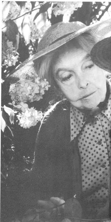
Doch das Alter wirft ein neues Licht auf den alltäglichen Kleinkram: Lillian Gish und

Der Alltag beschäftigt sie mit den kleinen Dingen, über die die Jugend lächelt, wenn sie sie bei den Alten beobachtet: Garten, Haus und Küche geben zu tun wie wenn es Investitionen für die Ewigkeit wären, Libbys einstige Haarpracht will gepflegt sein, wie wenn deren Schönheit nicht bloss noch in der Erinnerung existierte. Die kleinen Eifersüchteleien, die auf ältere Konflikte deuten, die Auseinandersetzung um ein neues Fenster mit Aussicht, das Sarah, die Romantische, mit Hoffnung belebt und Libby, die Sarkastische, in ihrer Blindheit beängstigt. Dazwischen ein Schwätzchen mit der Freundin von früher (einer runden und rosigen Ann Sothern), ein Flirt mit dem Nachbarn (Vincent Price als Gentleman mit rätselhafter Vergangenheit im zaristischen Russland), Spaziergänge, Mussestunden. Nichts, was nicht andere Sommerfrischer auch tun würden.