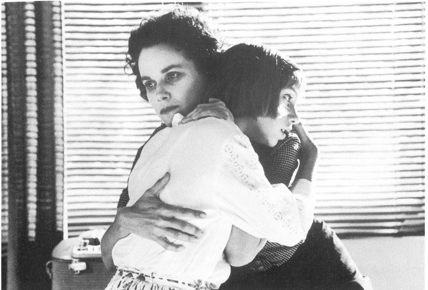
Barbara Hershey als Diana Roth mit Jodhi May als ihre Tochter Molly

Bei seinem ersten Aufenthalt am Kap weilte Menges nicht nur in Johannesburg, er besuchte Townships und nahm überall heimlich Szenen aus dem « Leben unter dem Apartheid-Regime » auf. Diese Erfahrung hat wesentlich dazu beigetragen, dass er, etwas mehr als zwanzig Jahre später auf Anhieb bereit war, aus Shawn Slovos Buch über ihre Erlebnisse in jenen Tagen einen Film zu schaffen. Das eigene Filmmaterial von damals diente ihm unter anderem als Fundus für die Arbeit, und es gibt in A WORLD APART Szenen wie jene der Demonstration in Alexander Township, die einen ausgesprochen dokumentarischen Charakter haben, eingeleitet durch eine poesievolle Einstellung über die Geleise der Vorstadt: Die Stille wird durchbrochen, Dampf wird abgelassen. Von Ken Loach hat Menges unter anderem gelernt, dass