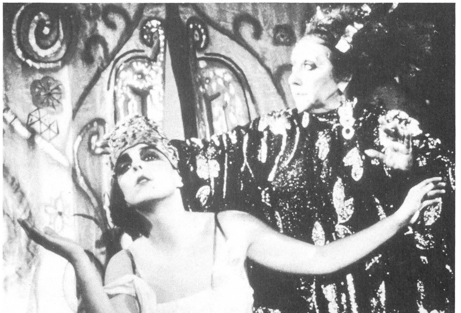
... aber Anita Berbers Heilsbotschaft kann wohl kaum noch jemanden schockieren