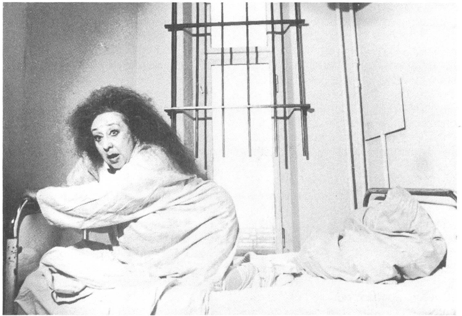
Praunheim setzt zwei Welten ganz zeichenhaft gegeneinander, wie es Märchenerzähler tun...

ROSA VON PRAUNHEIM: Diesen Superstar-Aspekt gab es bereits in den zwanziger Jahren, in dem Sinne, dass Persönlichkeiten gefragt waren. Mich fasziniert allein schon die überzogene Körpersprache in den Filmen der zwanziger Jahre, die Gestik, die vom Tanz herkam. Schauspieler dagegen dürfen heute überhaupt keine Persönlichkeit haben, müssen vielmehr anpassungsfähig sein und sollen eine realistische Identifikationsfigur für die Leute von nebenan darstellen.