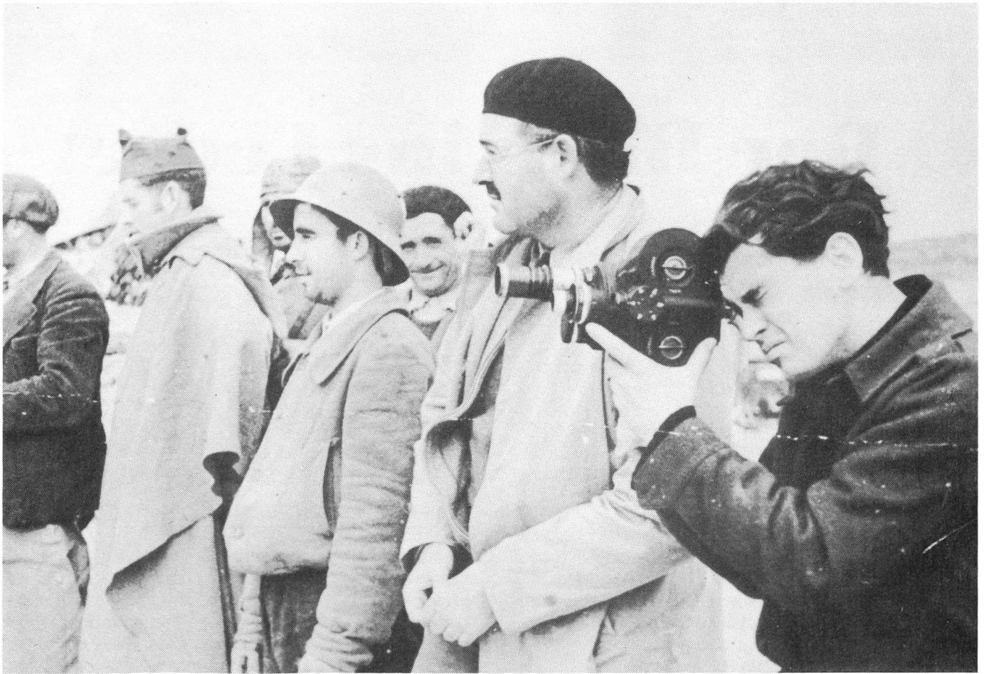
Joris Ivens und Ernest Hemingway bei den Dreharbeiten zu SPANISH EARTH (1937)

tig. Zu Beginn meines Werks vernachlässigte ich ihn, wie alle, die vom Stummfilm kamen. Dann verstanden wir das, und jetzt mache ich bereits beim Drehen Notizen für den Kommentar. Aber ich bin nun mal kein Schriftsteller, ich kann den Kommentar nicht formulieren, nur exakt den Inhalt bestimmen, von dem, was gesagt werden muss. Wenn etwa ein See im Regen besonders schön aussieht, sage ich nicht: das ist schön.