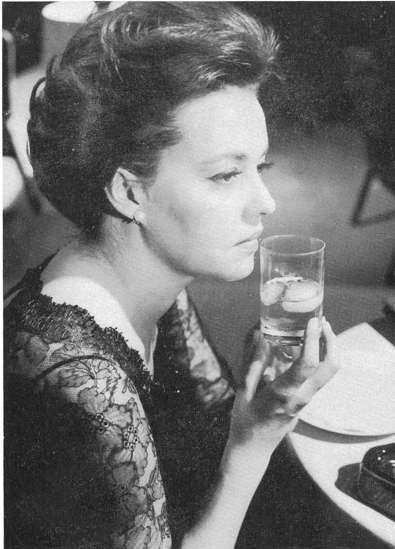
Jeanne Moreau in LA NOTTE (1961) von Michelangelo Antonioni