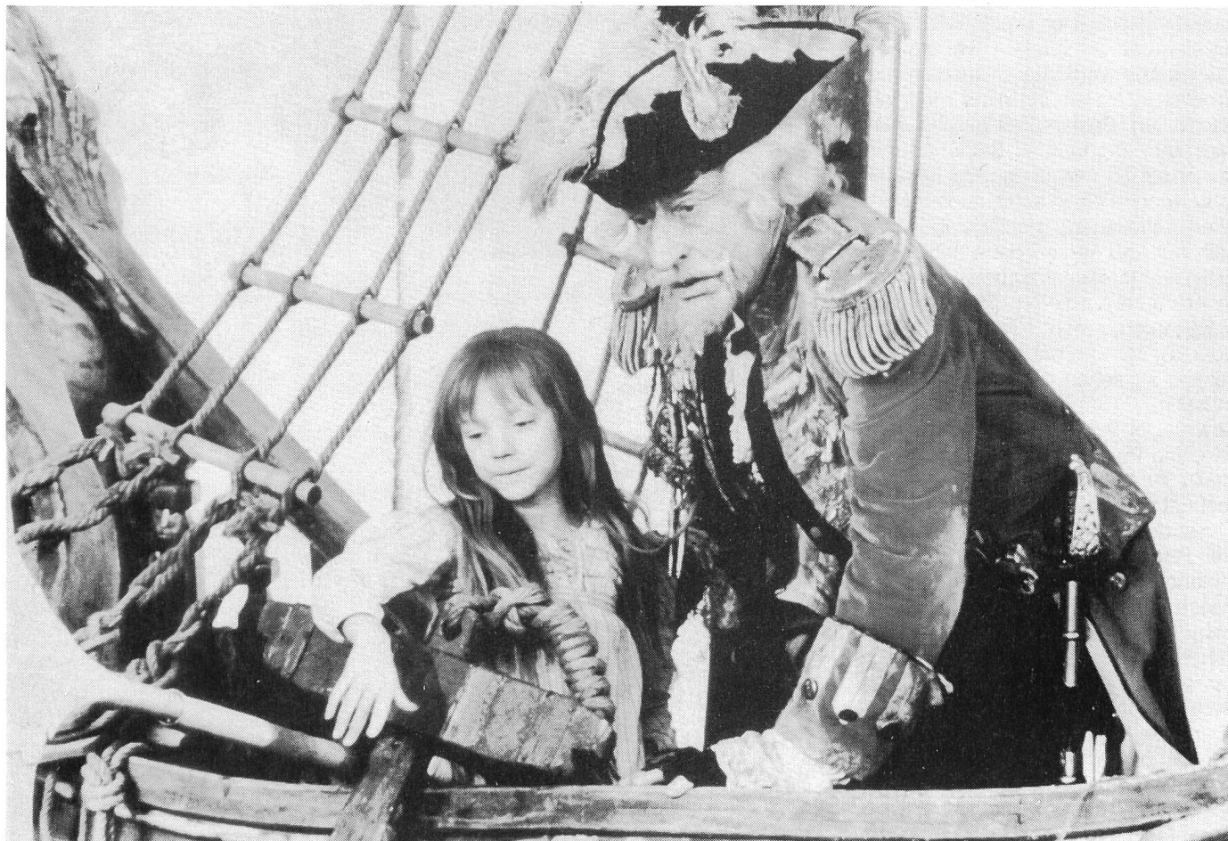
Der Greis Münchhausen wird durch die Neugier eines achtjährigen Mädchens nocheinmal aus der Resignation herausgerissen

In der Exposition von TIME BANDITS erzählt Kevin seinen desinteressierten Eltern von Agamemnon, von dem er offenbar ganz aktuell im Geschichtsunterricht gehört hat. In seinem Zimmer befindet sich die Spielzeugfigur eines Speerkämpfers der griechischen Antike. Als Kevin im Bett liegt, dringen die ersten Phantasiefiguren in