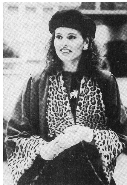
Geena Davis als Muriel

Das Ehepaar Sarah und Macon Leary hat den einzigen Sohn in einem Sommercamp beim Amoklauf eines Wahnsinnigen verloren. Das ist wahrlich nicht die ideale Ausgangsposition für eine amerikanische Komödie. Und doch ist Lawrence Kasdans THE ACCIDENTAL TOURIST nichts anderes, gehört der Film zum Besten, was dieses Genre anzubieten hat. Weshalb? Natürlich geht es nicht um den Mörder des unschuldigen Sohnes oder das Opfer selber, sondern um die Befindlichkeit der Eltern – vor allem um diejenige des Papas. Macon Leary also ist unsere Hauptperson, ein erfolgreicher Schriftsteller, Spezialist in Sachen Reiseliteratur, genauer: Ratgeber für den gestressten Vielreisenden, den Vertreter, Manager, Businessmenschen. Learys trockene Tips sind unentbehrlich für all jene, die nicht freiwillig von einem Pol zum anderen jetten wollen, sondern müssen. Womit auch der Filmtitel hinreichend erklärt wäre: Es geht um unfreiwillige Touristen, und der unfreiwilligste von ihnen ist Macon selber!