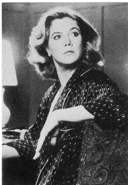
Kathleen Turner als Sarah

THE ACCIDENTAL TOURIST von Lawrence Kasdan