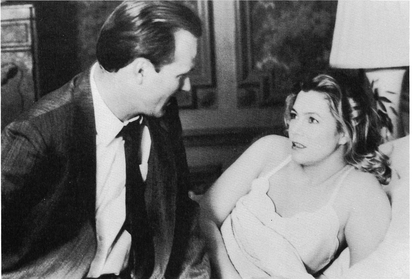
Malcolm befreit sich schliesslich doch aus dem Korsett von Halbherzigkeit und Lustfeindlichkeit

sen Filmkisten und den Gegebenheiten des aufwendigen und publikumsorientierten Unterhaltungskinos vertraut ist. Mit eigenen Arbeiten als Regisseur hat er sich einen guten Ruf geschaffen, vor allem mit seiner Reminiszenz an die schwarzen Krimis der vierziger Jahre, BODY HEAT (1981), oder mit dem sehr persönlich gefärbten THE BIG CHILL (1983) über die Jugenderfahrungen der Sechziger-Generation. Dass Kasdan alle Sparten des Films kennt, hat er 1985 mit der Realisierung des immerhin interessanten Neo-Westerns SILVERADO bewiesen.