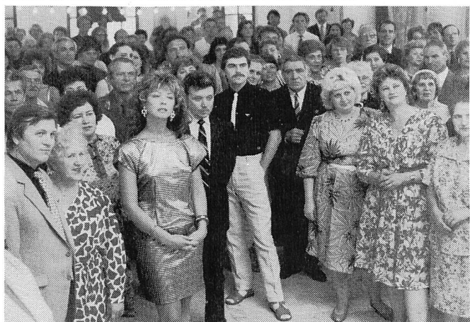
Zu Ehren des ersten Rock'n'Roll-Tänzers des Ortes ...