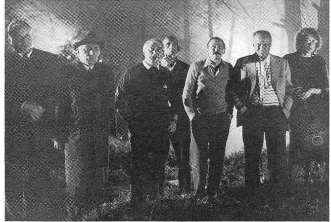
... und Justiz Tiefsinniges von sich geben möchte

reichen. Charlie Chaplin ist das beste Beispiel, das dafür im Kino existiert. Andere Beispiele wären sicher Fellinis LA STRADA , die Filme von Eisenstein oder ONE FLEW OVER THE CUCKOOS' NEST : Filme, die nicht nur vom künstlerischen Standpunkt aus erfolgreich waren, sondern auch beim Publikum ankamen. Mir scheint, das ist der beste Weg, Filme zu machen. Wichtig ist auch hier, ehrlich zu bleiben.