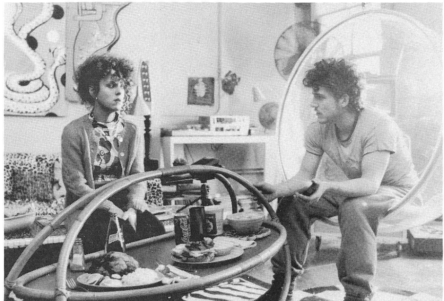
... oder was sie ihnen nicht antun mag, tun sie sich eben selbst an