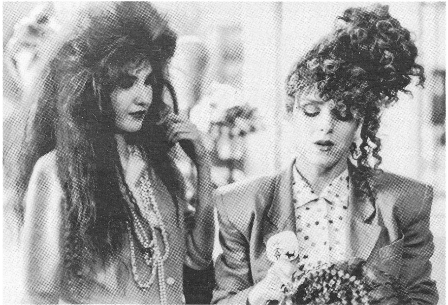
Eine Horde von Kleinbürgern: Was die Welt ihnen nicht bereits angetan hat...

Auf den ersten Blick ist dies nicht die Welt von James Ivory, wie wir sie aus seinen Filmen, zumindest den neueren, kennen (obwohl er mit JANE AUSTEN IN MANHATTAN bereits einmal ein