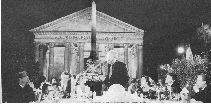
THE BELLY OF AN ARCHITECT

"Ich hatte gedacht, dass meine Interessen und Themen viel zu esoterisch wären für ein breites Publikum"