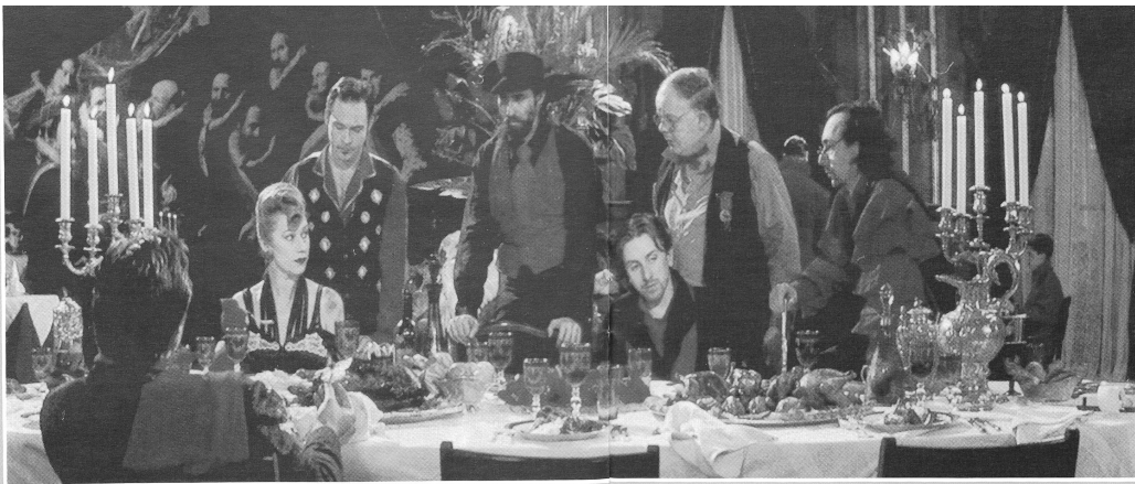
THE COOK, THE THIEF, HIS WIFE AND HER LOVER

"Mir scheint, dass die besten Maler sich bemerkenswerterweise oft nicht durch ein Übermass an intellektuellem Wissen auszeichnen"