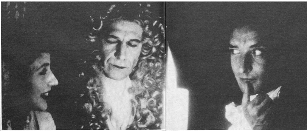
THE DRAUGHTSMAN'S CONTRACT