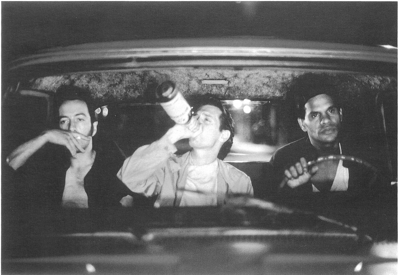
«Lost in Space»: Verloren im Niemandsland

Ein lautstark geführtes Telefongespräch gibt uns Aufschluss, dass diese Luisa, die da ankündigt, sie komme wegen verpasstem Anschlussflug einen Tag später an, Italienerin ist. Unerwartet hat sie Zeit, fährt mit dem Taxi in die Stadt, beginnt ebenfalls ziellos umherzuschweifen. In einem kleinen Laden will sie eine Zeitung kaufen, lässt sich von dem sympathisch-gewitzten Mann aber einen ganzen Berg an Illustrierten aufschwätzen. In einer Bar trinkt sie Kaffee, bleibt jedoch nicht lange alleine. Ein schlaksiger Mann mit schütterem Haar gesellt sich zu ihr, erzählt ihr, dass er eines Abends einen Autostopper mitgenommen habe, der der Geist von Elvis Presley war. Dieser habe ihn beauftragt, ihr, ja ihr, diesen Kamm zu übergeben. Luisa stutzt. Freilich habe er, fährt der Unbekannte fort, ihm auch noch gesagt, er solle dafür eine Übergabegebühr von zwanzig Dollar in Empfang nehmen. Die junge Italienerin gibt ihm das Geld – damit sie ihre Ruhe hat. Nachdem dieser sie nach dem Verlassen der Bar weiter belästigt, sucht auch Luisa in besagtem Hotel Zuflucht, trifft dort an der Reception auf DeeDee, die sich kein Zim-