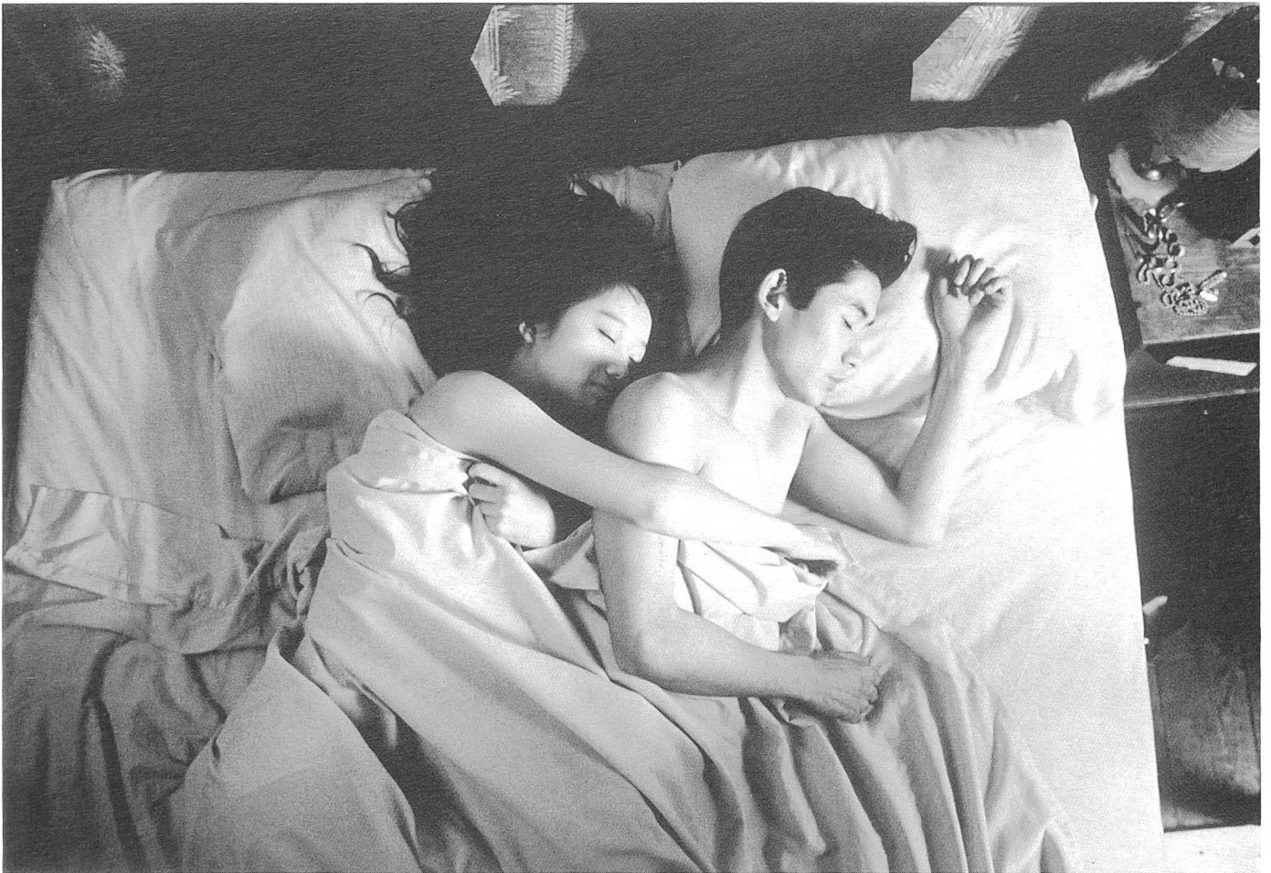
«Far from Yokohama»: Wir sind halt in Amerika