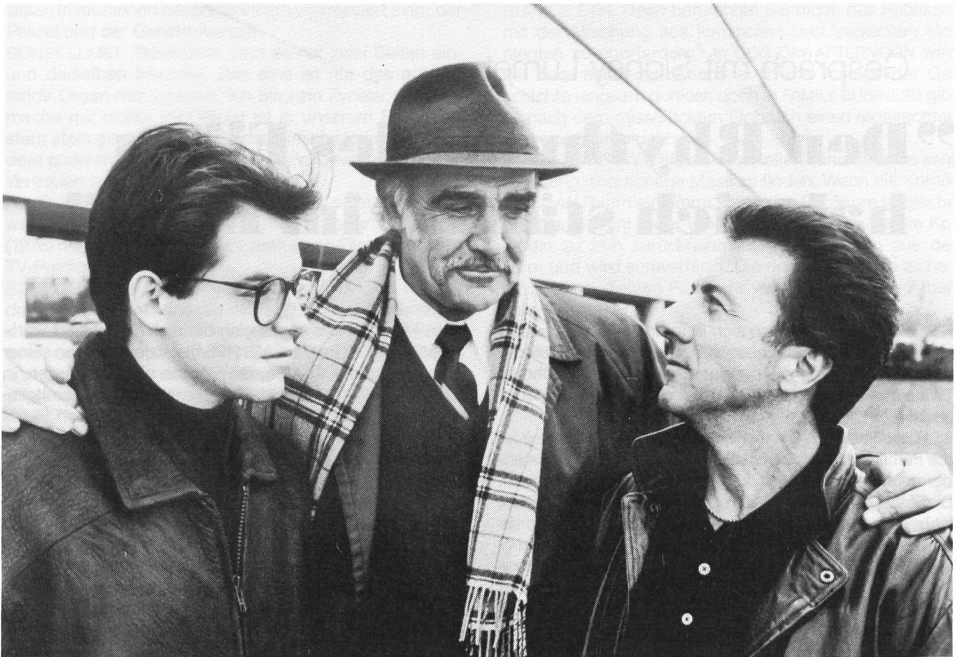
Zählen die Gewinne weniger als die in Kauf genommenen Risiken

haben Vito und Adam von Jessie gelernt, dass der Ruhestand erst mit dem Tod beginnt. Am Ende eines Lebens zählen die erzielten Gewinne vielleicht weniger als die in Kauf genommenen Risiken.