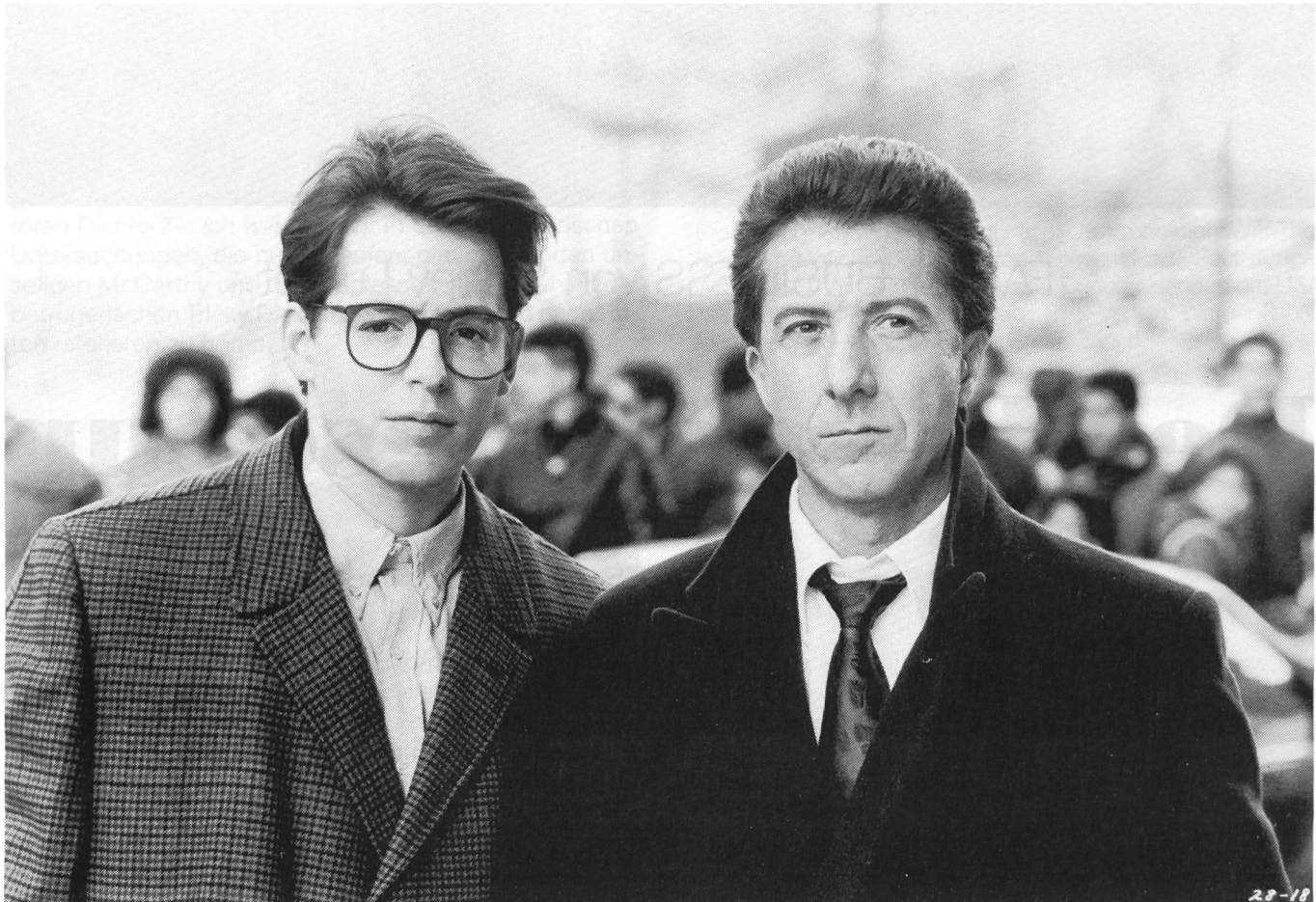
Komfortables, aber freudloses Dasein mit einer Firma für Fleischverpackung

Nur ein einziges Mal bilden die drei eine Einheit: während des capers . Dabei haben alle unterschiedliche Motive. Jessie lebt nur in der Gegenwart, ein leidenschaftlicher Verbrecher, dessen Leben ein einziges Provisorium ist. Für ihn ist dies vor allem ein Bruch, der in der Familie bleibt. Für Vito, der mit seiner Firma für Fleischverpackung ein komfortables, aber freudloses Dasein fristet, ist dies ein Ausbruch aus einer ungeliebten Vergangenheit. Adam dagegen bricht auf in eine ungewisse Zukunft. Für sein Leben hat er noch carte blanche . Lumet betont die Einbruchsszene durch die Farbgebung. Sie hat drei Elemente: die schwarze Verkleidung der Einbrecher, die weissen Wände des Labors, und – das einzige Mal in diesem Film – buntes Licht. Dann bricht wieder der graue Alltag an. Doch auch wenn der Einbruch misslingt,