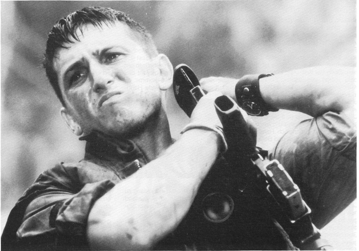
Jeden Schritt, jede Handlung mit dem Gewissen in Einklang bringen