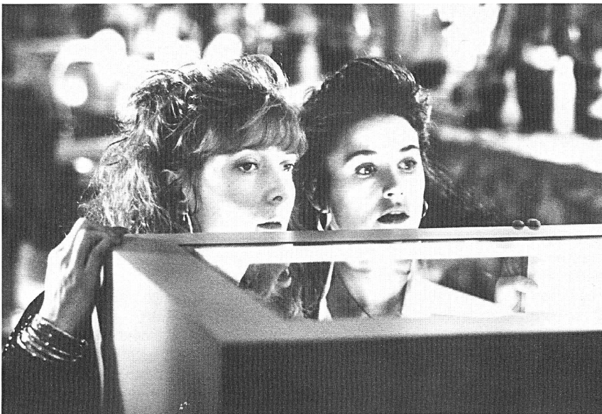
Glenn Headly als Joyce Urbanski und Demi Moore als Cynthia Kellogg in MORTAL THOUGHTS

gegenen ihnen im Verlauf der Fahrt, immer tiefer dringen sie nach Arizona ein, wo sich die Wüste und die Cowboys noch heute darüber zu streiten scheinen, wer von ihnen der stärkere ist. Dann erreichen sie Monument Valley und den Grand Canyon: Naturdenkmäler der traditionellen Vorstellungen von Männlichkeit.