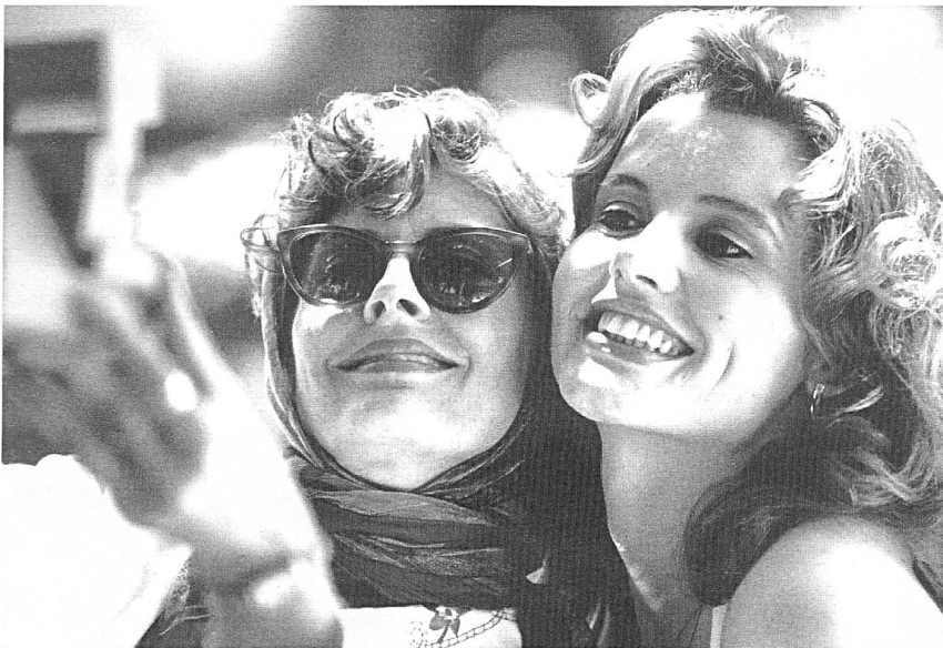
Susan Sarandon als Louise und Geena Davis als Thelma in THELMA & LOUISE