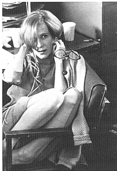
Amanda Plummer als Lydia

(Parry dagegen bleibt ohne Exposition). Nach seinem Hörfunk-Auftritt bereitet sich Jack darauf vor, demnächst auch Fernseh-Star zu sein, so dass das Gesicht hinter der Stimme endlich sichtbar wird. Aber seine mehrfach deklamierten Worte «Forgive me!» , eine einstudierte Dialogphrase aus seiner zukünftigen Fernseh-Show, sind nach oben gespro-