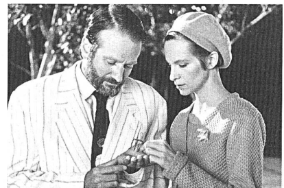
Robin Williams mit Amanda Plummer

Auf der komödiantischen Ebene erzählt der Film vor allem von der Beziehung dieses seltsamen Männerpaars Lucas und Parry zu den Frauen Anne und Lydia, die trotz ihrer materialistischen Bodenständigkeit und ihres buchhalterisch-kalkulierenden Denkens das Herz auf dem rechten Fleck zu haben scheinen. Jack springt am Ende über seinen Schatten, wenn er sich zu seinen Gefühlen zu der Videothekarin Anne bekennt, die sich in den drei Jahren seiner Existenzkrise um ihn gekümmert hat. Und der Don-Quijote-Ritter Parry, dem die Wirklichkeit anders erscheint als dem Normalsichtigen, erobert sich als seine Dulcinea eine unscheinbare, verschrobene Büroangestellte mit unkultivierten Manieren, die in seiner Phantasie zum Edelfräulein avanciert. Gilliam kann sich bei der Umsetzung