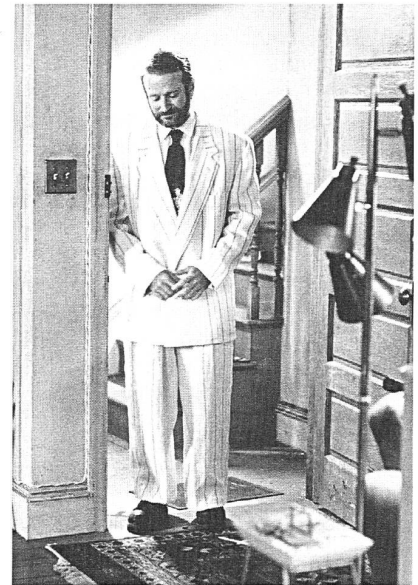
Robin Williams als Parry

(Parry dagegen bleibt ohne Exposition). Nach seinem Hörfunk-Auftritt bereitet sich Jack darauf vor, demnächst auch Fernseh-Star zu sein, so dass das Gesicht hinter der Stimme endlich sichtbar wird. Aber seine mehrfach deklamierten Worte «Forgive me!» , eine einstudierte Dialogphrase aus seiner zukünftigen Fernseh-Show, sind nach oben gespro-