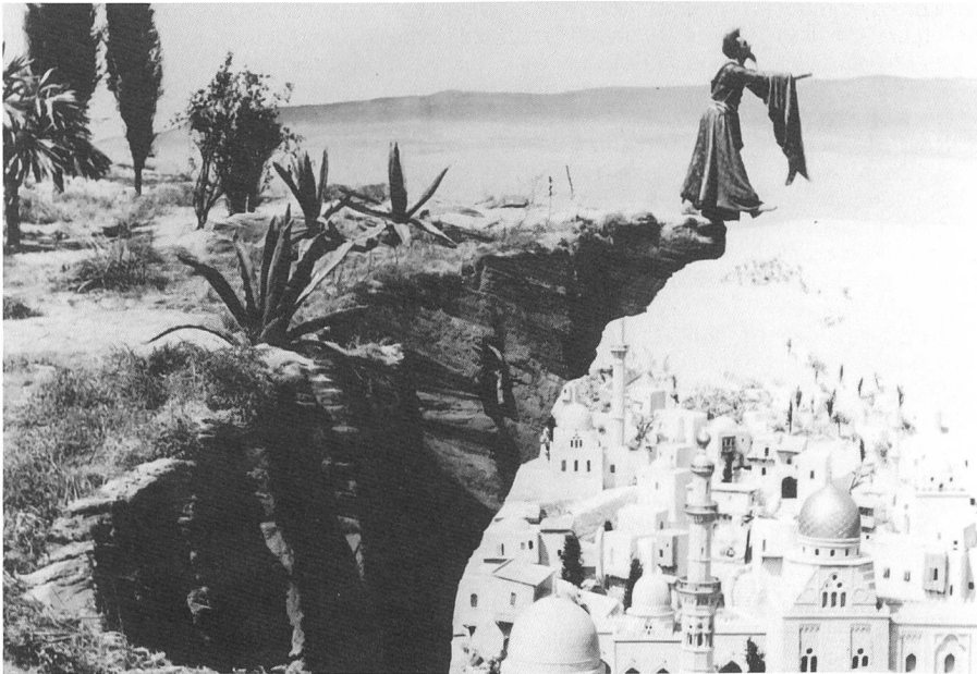
DIE GESCHICHTE VOM KLEINEN MUCK (1953) Regie: Wolfgang Staudte