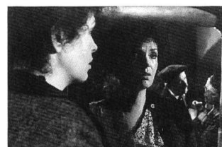
LIEBE IST KÄLTER ALS DER TOD

Der freie Strom der Gefühle, egal auf welcher Seite eines gesellschaftlichen Wertesystems sie einzuordnen wären, das war die grosse Utopie des Rainer Werner Fassbinder. Völlig frei hiess für ihn, alle Artikulationsformen menschlicher Existenz zuzulassen, die Zartheit der Liebe ebenso wie die Brutalität des Bösen, die häufig doch nur die Kehrseite derselben Medaille sind. Fassbinders Utopie ist naiv und anarchistisch. Sie postuliert, dass sich die Welt in einem chaotischen freien Spiel der Gefühle von Individuen ausdifferenziert und nirgends anders. Jegliche gesellschaftliche Norm, und sei sie noch so wohlmeinend formuliert, führt in seiner Weltsicht unweigerlich zur Unterdrückung und definitiven Unmöglichkeit einer freien Entfaltung von Menschlichkeit. Fassbinder ist in seiner grossen Sehnsucht und in seinem Vertrauen in das potentiell Menschliche davon ausgegangen, dass eine solche Welt eine zärtliche und liebevolle sein müsste. Deshalb hat er sich um konkrete Ausgestaltungsformen seiner Utopie ebenso wenig gekümmert wie um eine Präzision seiner Gesellschaftskritik. Sein utopischer Humanismus ist, zugegeben, vage und unscharf. Bloch hätte ihn als private