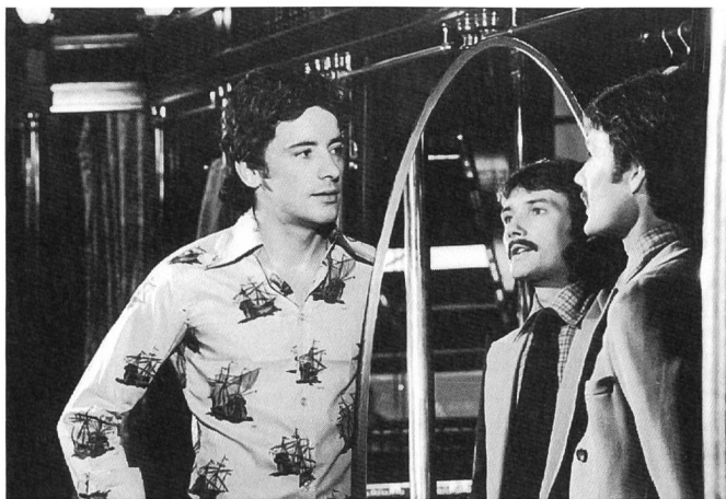
FAUSTRECHT DER FREIHEIT

senschaft verstanden haben. Nicht nur, dass er ihn zur Projektions- und Reflexionsfläche für seine Homosexualität nahm, wie er in einem vielzitierten Aufsatz kurz vor der Ausstrahlung von BERLIN ALEXANDERPLATZ bekannte. Vor allem nutzte er die disparaten Montageelemente des Romans, um mit ihrer Hilfe eine Hauptfigur, eine Figurenkonstellation und einen schier biblischen Konflikt des liebes- und leidensfähigen Menschen in einer unwirtlichen Welt zu schaffen, wie er komplexer und differenzierter im Film wohl selten entwickelt worden ist. Die Produktform der Fernsehserie, die hier wirklich einmal zu ihren ureigensten Darstellungsmöglichkeiten gekommen ist, gab ihm dafür mehr als fünfzehn Stunden Erzählzeit.