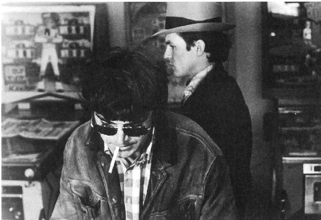
LIEBE IST KÄLTER ALS DER TOD

KATZELMACHER zeigt die dumpfen Gefühle einer Gruppe von jungen Menschen in der Vorstadt. Ihre Gespräche und Verhaltensweisen sind durch Stereotype geprägt, die Kommunikation fast bis zur Sprachlosigkeit verkümmert. In ihren Tagträumen klammern sie sich an kleinbürgerliche Wunschvorstellungen: die Frauen sehnen sich nach einer Heirat, die Männer nach Geld. Obwohl Franz zu dieser Gruppe gehört, ist er eine Randfigur. Fassbinder zeigt dies, in dem er Franz zumeist an den Rand des horizontal gestaffelten, flachen Bildaufbaus placiert. Nur in den Tableaus mit den Frauen darf er den Bildmittelpunkt einnehmen. Franz hat keine feste Beziehung, er kauft sich körperliche Liebe. Trotzdem bittet er Rosy, die er bezahlt, ob «man nicht ein bisschen mehr machen (kann). Als wär's Liebe oder so.» Franz hat wohl nicht mehr die Hoffnung, eine Liebe wirklich leben zu können. Um so wichtiger ist ihm die Simulation davon. Doch selbst die Vorspiegelung wird ihm vorenthalten. Wohl selten ist in einem Film das Tauschverhältnis Geld gegen Körper und simuliertes Gefühl so beiläufig und dabei doch so brutal entlarvend