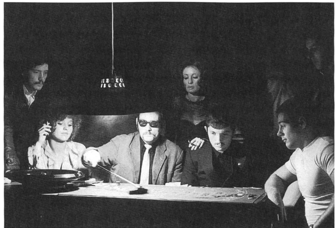
GÖTTER DER PEST

trotz aller Anstrengungen und Opfer nicht zu verwirklichen ist, verrät sie Franz an die Polizei. Bruno ist der eiskalte Engel der Begierdelosigkeit, der Franz an das Syndikat verrät. Beim gemeinsamen Banküberfall wird er erschossen. Im Tod ist Franz ihm zum ersten Mal