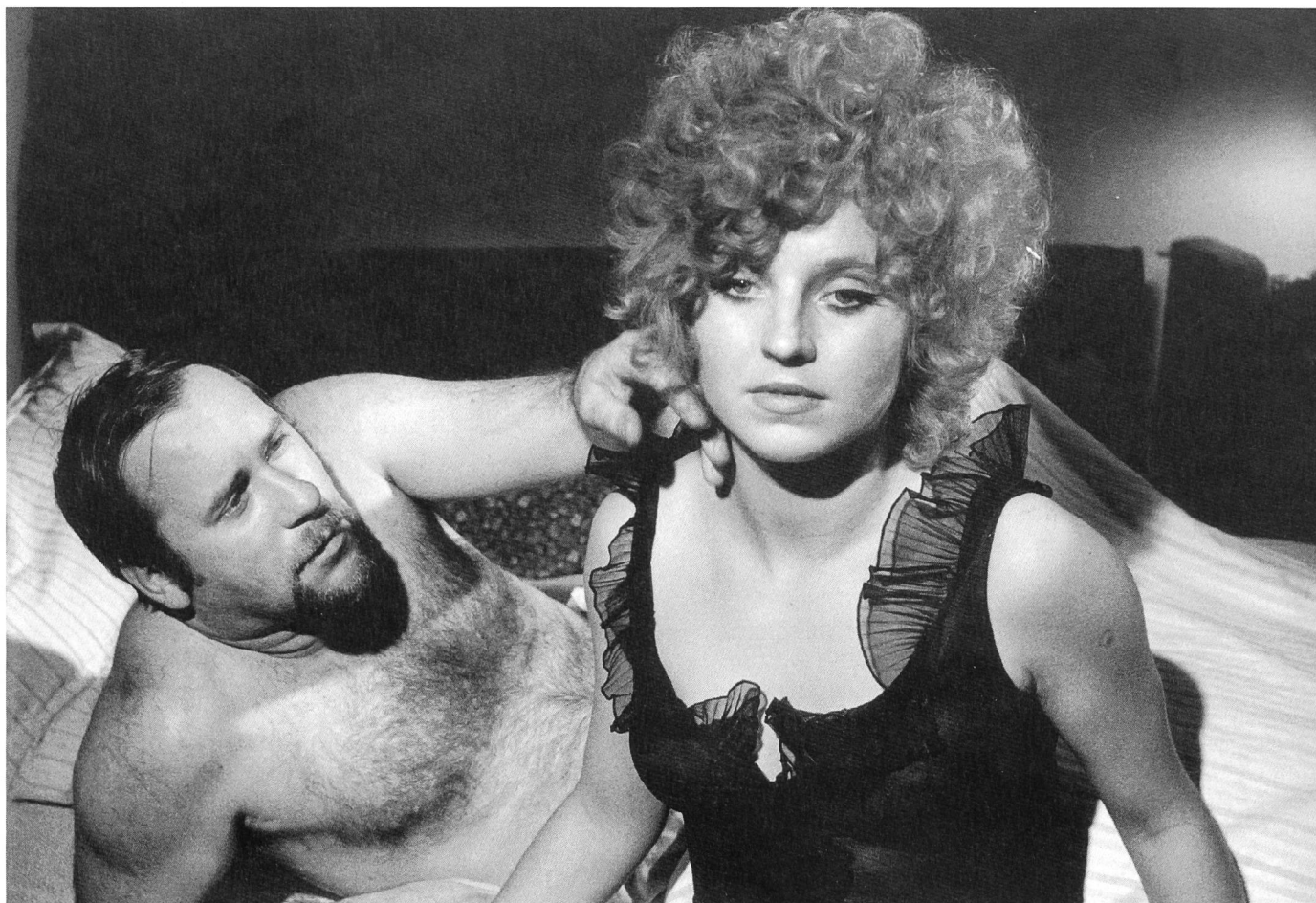
GÖTTER DER PEST

Fassbinder hat diesen bedrückenden sozialpsychologischen Tatbestand scheinbar teilnahmslos mit starrer, frontal ausgerichteter Kamera in halbnahe und halbtotale Exterieur-Aufnahmen zumeist vor einer öden Hauswand aufgenommen. Sein Hyperrealismus, den er wiederum in grösstmöglicher Helligkeit und Übersichtlichkeit des Bildaufbaus arrangiert, ist von einer artifiziellen Kälte. Doch die war genau kalkuliert. Wilhelm Roth beklagte in einem viel zitierten Kommentar, dass damit «eine Zündschnur gelegt, aber die Ladung geht nie los, der Film explodiert an keiner Stelle». Genau das ist bezweckt. Fassbinder hat in der filmischen Artikulation Mittel gefunden, wie sich eine von den Figuren empfundene, paralysierende Wut auf den Zuschauer überträgt.