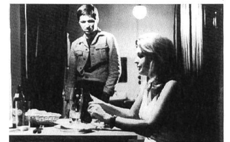
FAUSTRECHT DER FREIHEIT

berechnet, dass er genau die Empörung der Zuschauer provozieren wollte. Aus den bewusst misshandelten Zuschauererwartungen und -gefühlen sollte sich eine «Sehnsucht nach etwas anderem» erheben. Um diese Sehnsucht zu einer revoltierenden werden zu lassen, wählte Fassbinder im Rahmen des melodramatischen Modells immer die schlimmstmögliche Wendung. Er versuchte, dem Zuschauer auch die letzte Fluchtmöglichkeit zur affirmativen Aufrechterhaltung gefühlig, gesellschaftlich sanktionierter Sentimentalität zu vorstellen. Der Unmut und der Überdruck, den er so erzeugte, sollte eine Phantasie provozieren, die Kopf und Gefühle befreit. (Peter Schneider hat 1969 in seiner programmatischen Lesart von Freud und Marx etwas ähnliches gefordert und zur revolutionären Entwicklung einer "progredienten Phantasie" aufgerufen, um den Wünschen, Gefühlen und Trieben eine umfassende Realisierungschance zu ermöglichen.)