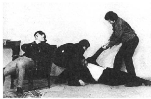
LIEBE IST KÄLTER ALS DER TOD

helden: wirklich frei zu sein und seine Gefühle unreglementiert leben und austauschen zu können. Dieser Kinotraum verlangt nach dem grossen Genre. Fassbinder wählt dazu das des Gangsterfilms. In der Eingangssequenz wird Franz vom Syndikat verhört und gefoltert. Er will nur auf eigene Rechnung arbeiten, will sich keiner Norm unterwerfen. Das Syndikat (das neutral wie eine Behörde inszeniert wird) setzt Bruno auf ihn an. Bruno ist eine weitere Ikone des Kinos: die schöne, aber berechnende Versuchung im Dienste der Mächtigen. Fassbinder inszeniert ihn entsprechend. Er zeigt bei Brunos erstem Auftritt sein verlockendes, feminines Gesicht in einer starren, stummen, mehr als dreissig Sekunden verweilenden Nahaufnahme. Darunter hat der Regisseur eine sehnsüchtige romantische Musik gelegt. Doch da ist noch Joanna, von der Franz dem Bruno beim ersten Zusammentreffen sagt: «Die hab ich lieb». Joanna geht für Franz auf den Strich. Die erste Sequenz mit beiden Figuren zeigt den dumpf vor sich hin trinkenden Franz, der bei ihrem Eintritt nur kurz aufblickt und fragt: «Wie war's?». Stumm legt sie das Geld auf den Tisch.