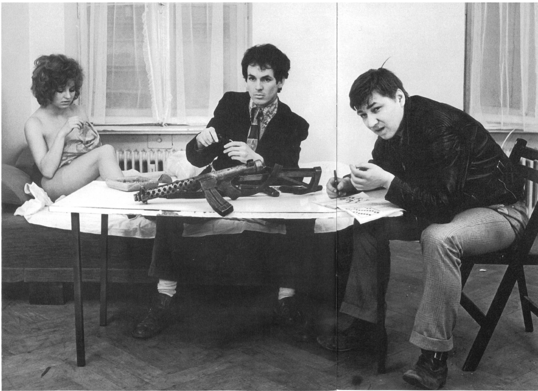
LIEBE IST KÄLTER ALS DER TOD