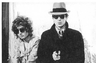
LIEBE IST KÄLTER ALS DER TOD BERLIN ALEXANDERPLATZ FAUSTRECHT DER FREIHEIT

Bei der Entdeckung neuer filmsprachlicher Lösungen trieb Fassbinder die gleiche begierige Neugier, mit der er versuchte, zwischenmenschliche Beziehungsmuster