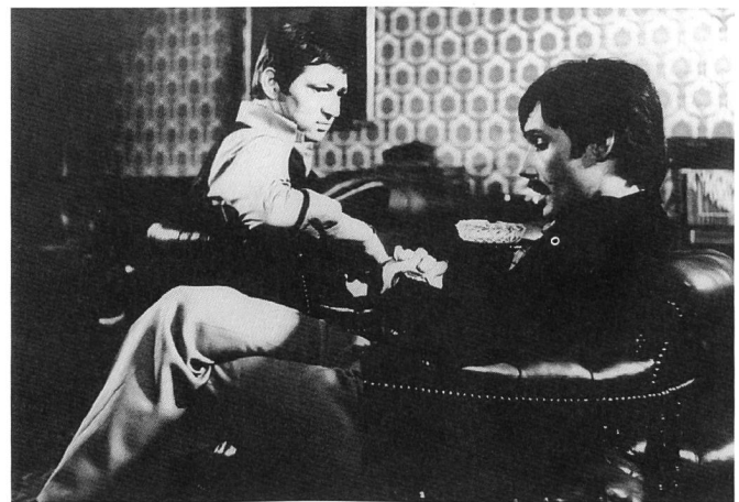
FAUSTRECHT DER FREIHEIT

In einem wahrhaft dionysischen Kampf zeigt Fassbinder die Mühen, Wunden und Verstümmelungen des Franz Biberkopf in seinem Wahn, zu lieben und ein guter Mensch sein zu wollen. Wie Hiob (den Fassbinder als allwissender Erzähler des öfteren kommentierend her-