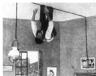
BALOO von Victorin Jasset

ist die Entführung der Dorfschönen gezeigt. Baloo biegt einen Zweig, an dem er kopfüber hängt, durch sein Gewicht nach unten, greift das