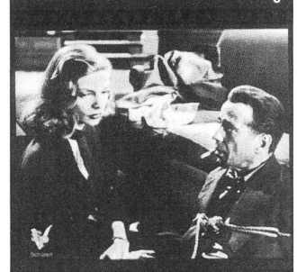
THE NATURE OF SPACE von Frank Scheffer (1992)