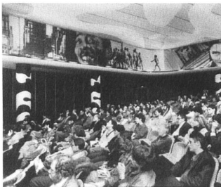
Filmpodium im Studio 4

Das Wirken des Film-podiums war, ist und bleibt unverzichtbar für die Filmkultur – möge ihm seine Heimstätte, in der es sich eingerichtet hat, für mindestens weitere zehn Jahre erhalten bleiben.