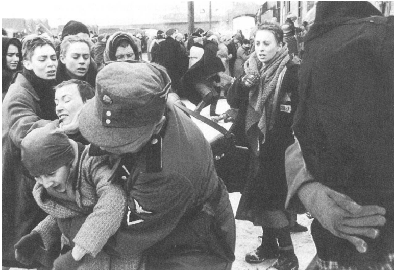
Steven Spielberg und Steven Zaillian

Gespräch mit Drehbuchautor Steven Zaillian