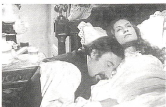
MADAME BOVARY Regie: Claude Chabrol (1991)

Selbstfesselungskünste der modernen Frau im Geschick der Emma vorauszuahnen und als Protokollant des weiblichen Archetyps präzise zu beschreiben. Ist sie jung, ist sie alt, grazil oder gut ausgestattet? – einerlei, denn im flaubertschen Koordinatensystem der weiblichen Psyche erkennt jedermann seine Emma, will heissen, sich selbst. Die Durchlässigkeit der Figur verunmöglicht vielleicht sogar ihre körperliche Präsenz auf der Leinwand (oder im Fernsehen, weshalb ich ihr Gesicht vergass). Schon ihr Schöpfer durchdrang sie bis zur völligen Identifikation, der Leser schafft sie sich erneut – warum nicht sollte jeder Regisseur die eigene Madame Bovary erfinden?