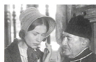
MADAME BOVARY Regie: Claude Chabrol (1991)