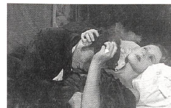
MADAME BOVARY Regie: Jean Renoir (1934)