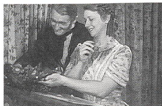
MADAME BOVARY Regie: Jean Renoir (1934)