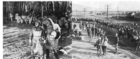
4 ROBIN HOOD (1922) 5 Allan Dwan bei den Dreharbeiten zu einem unbekanntem Western