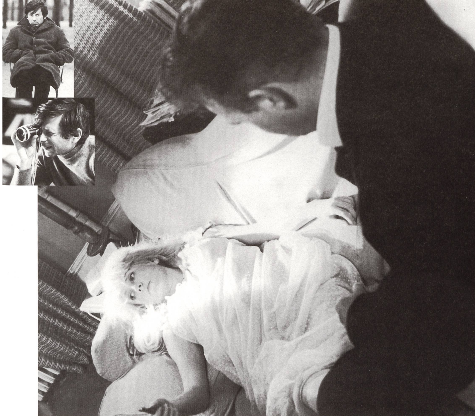
1 Roman Polanski bei Dreharbeiten zu LE LOCATAIRE