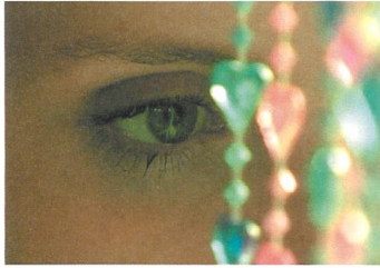
NACHBEBEN Regie: Stina Werenfels