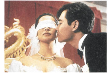
THE WEDDING BANQUET Regie: Ang Lee