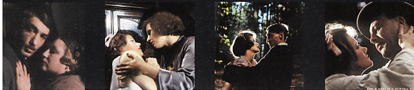
1 Dreharbeiten, ganz links Rainer Werner Fassbinder, in der Mitte der Kameramann Xaver Schwarzenberger; 2 Günter Lamprecht als Franz Biberkopf und Elisabeth Trissenaar als Lina; 3 Gottfried John als Reinhold mit Helen Vita als Fränze; 4 Barbara Sukowa als Mieke mit Hanna Schygulla als Eva; 5 Barbara Sukowa mit Gottfried John; 6 Barbara Sukowa und Günter Lamprecht

leben zu können. Er war nicht mehr und nicht weniger davon überzeugt, «dass ich über nichts als über Menschen Bescheid weiss, dass ich von nichts als von Menschen eine Ahnung habe, wenn überhaupt» (Rainer Werner Fassbinder im Interview 1976). Mit diesem radikalen Anthropozentrismus näherte er sich der Welt und den Menschen – und verstörte sie damit meist. Auch privat versuchte er, in psycho- und gruppodynamischen “Wahrheitsspielen” und natürlich in allen Formen des Sexuellen, das Menschliche unersättlich aufzusaugen und auszuloten. Wahrscheinlich ist auch eine seiner Lieblingsmetaphern, das Schlachthaus, Ausdruck für diese naive Wahrheitssuche nach den Gründen und Abgründen des Menschlichen. Im Abziehen der Haut, im Aufbrechen des Fleisches drückt sich im doppelt metaphorischen Bild der geschundenen Kreatur auch ein infantiles Interesse nach dem aus, was den Menschen in seinem Innersten ausmacht. Fassbinder suchte nicht mehr und nicht weniger als nach der nackten Seele.