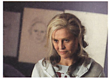
Julie Christie in AWAY FROM HER Regie: Sarah Polley