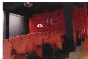
Kino Freier Film Aarau