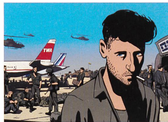
WALTZ WITH BASHIR Regie: Ari Folman