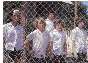
SWEET MUD Regie: Dror Shaul

Die vierte Ausgabe des Zurich Film Festival findet vom 25. September bis 5. Oktober statt und wird mit DER BAADER MEINHOF KOMPLEX von Uli Edel eröffnet. Im internationalen Wettbewerb wird in den Kategorien Bester Spielfilm, Bester Dokumentarfilm und Bestes Debüt je ein «Goldenes Auge» vergeben. Der Schauspieler Peter Fonda wird die internationale Jury präsidieren, der Wettbewerb von insgesamt 24 Filmen aus aller Welt bespielt.