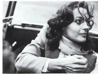
Romy Schneider während den Dreh- arbeiten zu GRUPPENBILD MIT DAME, Regie: Aleksandar Petrovic