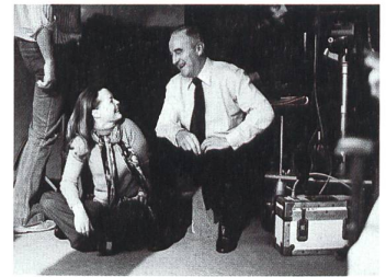
Romy Schneider und Claude Sautet während den Dreharbeiten zu UNE HISTOIRE SIMPLE

«Romy Schneider war ein Kinowunder. Und zugleich eine Frau, die sich gegen die engen Konventionen ihrer Zeit auflehnte, die sich nach Freiheit, Geborgenheit und Liebe sehnte, deren Aus- und Aufbrüche freilich immer wieder ein tragisches End fanden», schreibt Berlins Bürgermeister Klaus Wowereit im Grusswort, das dem Katalog zur Ausstellung über Romy Schneider vorangestellt ist. Leben und Werk der 1982 an Herzversagen gestorbenen Schauspielerin sind eng miteinander verzahnt, wobei die Filme vielleicht allzu oft ausschliesslich als Widerspiegelung ihres von einer gewissen Tragik bestimmten Lebens gesehen werden. So geht auch die anhaltende Faszination dieser Frau eher vom Leben als von den Filmen aus, mit Ausnahme ausgerechnet der «Sissi»-Trilogie (1955–1957), die auch diesmal zu Weihnachten wieder im deutschen und österreichischen Fernsehen ausgestrahlt wurde (wo sie mit einem neuen Zweiteiler, SISI, konkurrierte). Ausgerechnet, weil Romy Schneider zeitlebens gegen das «Sissi»-Image ankämpfte, auch wenn sie nie bestritten hat, dass es diese Filme waren, die ihren frühen Ruhm begründeten.