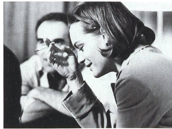
Romy Schneider und Michel Piccoli bei den Dreharbeiten zu LA VOLEUSE, Regie: Jean Chapot