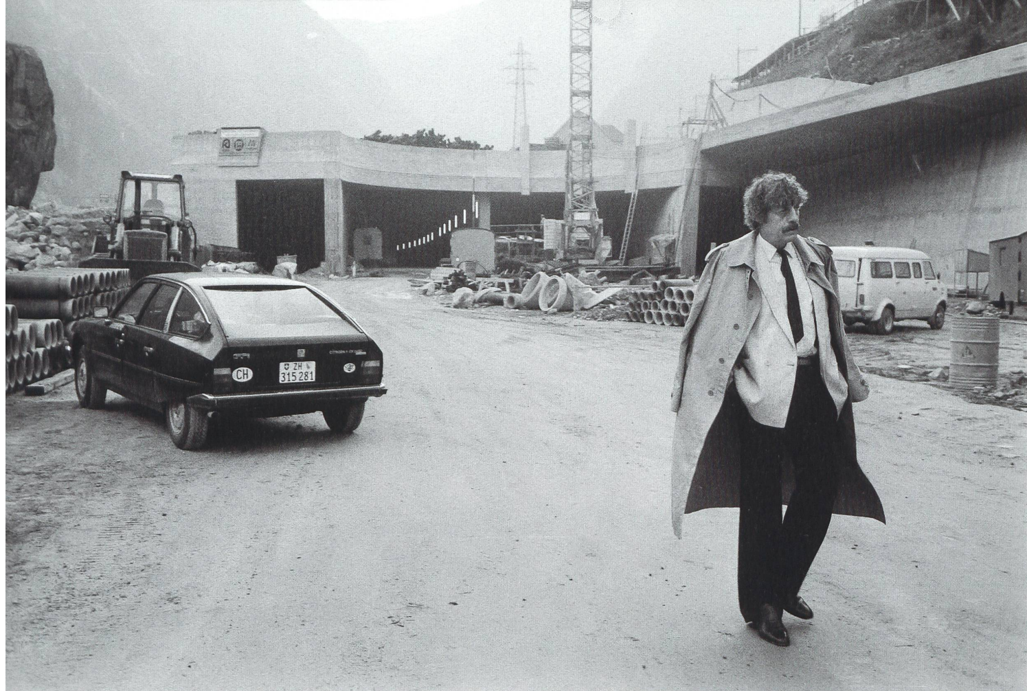
FILMBULLETIN 01.10 DIRECTOR'S CUT

Krieger also, der helvetische Alltagsodysseus: Seine Kirke ist eine baslerisch toughe Coiffeuse im Mittelland und weiss, was Penelope zu Hause fühlen muss. Insofern vertritt sie, der kein Mann etwas vormachen kann, ein wenig Kriegers zu Hause schmachtende Gattin. Homers Königstochter Nausikaa ist hier ein Bündner Bergbauernmädchen im frischen Schnee; zu Hause am Esstisch zieht es an einem ausgezupften Haar stumm ein Papierschiffchen vor Kriegers grossem Schnauz vorüber. Das Gebastel zerfällt, «scho Schiffbruch», murmelt der Bauer. Eine schönere und leisere Erotik muss man im Schweizer Film schon weit suchen.