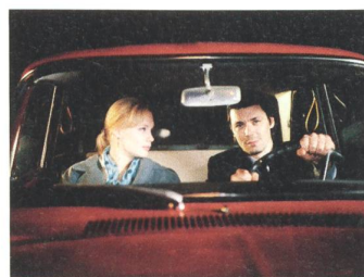
LIGHTS IN THE DUSK Regie: Aki Kaurismäki