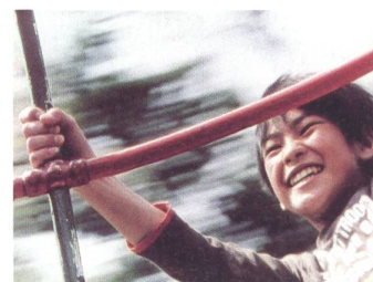
NOBODY KNOWS Regie: Hirokazu Kore-eda