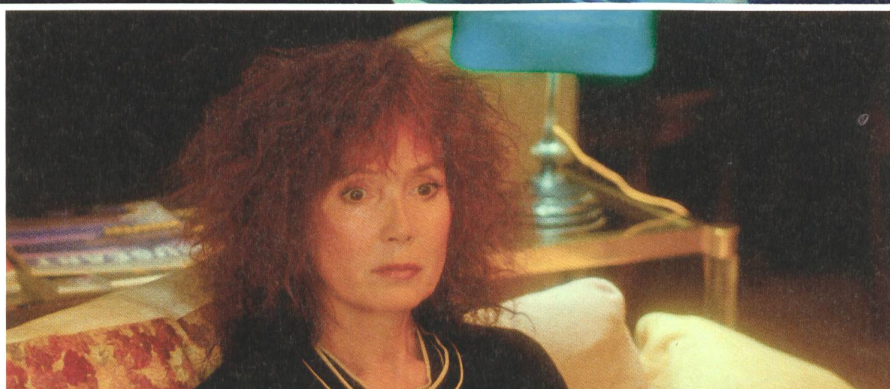
1 ON CONNAÎT LA CHANSON; 2 PAS SUR LA BOUCHE; 3 L'AMOUR À MORT; 4 MÉLO; 5 SMOKING/NO SMOKING; 6 bei den Dreharbeiten zu L'AMOUR À MORT; 7 bei den Dreharbeiten zu MÉLO; 8 bei den Dreharbeiten zu LES HERBES FOLLES